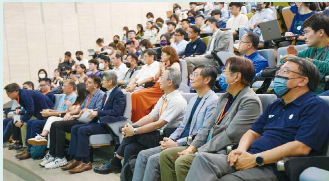
本次演講吸引眾多師生參與

性的能力，而若用在中等及初等教育階段，則需要教師適時的輔助，並教導使用科技產品的正確態度。「這是所有科技產品都會面臨到的問題，不只有 ChatGPT。科技始終於人性，應該要注意的是使用者的觀念與態度，而不是禁止科技產品發展，我們要擁抱科技產品，支持它在教育各面向的應用。」