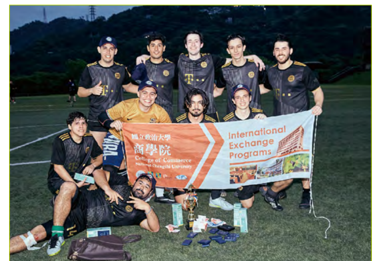
Team UPTP'22 from Paraguay with the golden trophy and ready to celebrate their victory.

exciting to watch, with the audience cheering and applauding every good play. The teams were evenly matched, with no clear favorites. Each team had their strengths and weaknesses, and it was a matter of who could exploit them better. The games were also unpredictable, with some teams staging comebacks and others conceding goals at crucial moments.