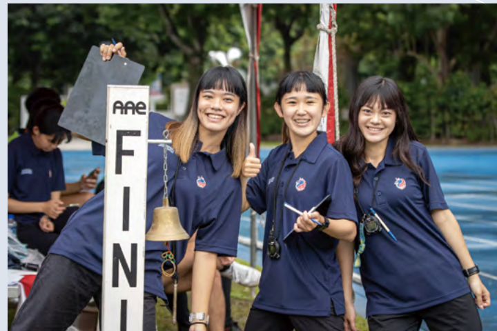
場邊工作人員熱情參與