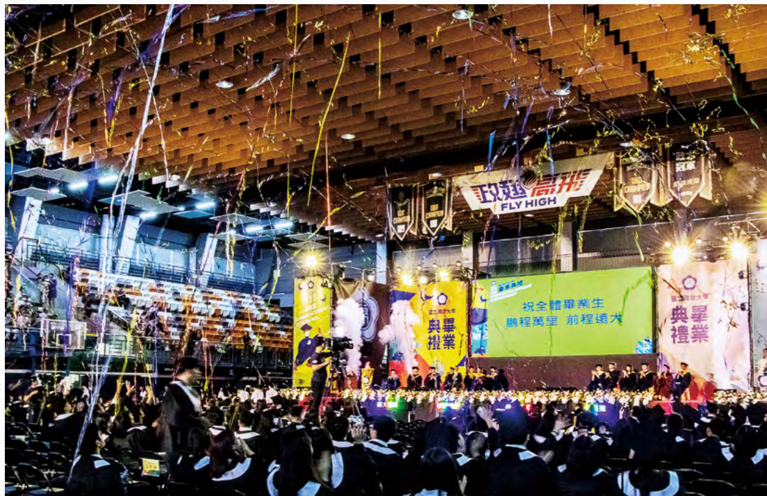
上圖：校長與畢業生代表一同點燃電子火炬（攝影：秘書處） 下圖：在校歌合唱樂聲中撒下滿天彩帶為典禮畫下圓滿句點（攝影：秘書處）