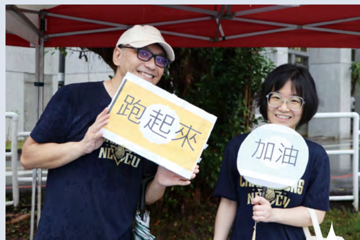
應援團自製手拿板幫忙加油、打氣