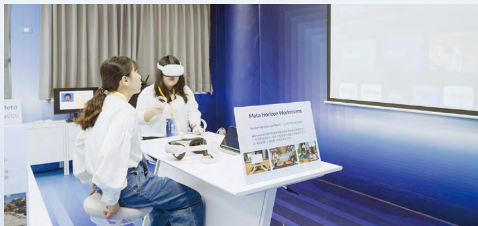
「傳播學院 XR 中心實驗室」是臺灣第一所大學與 Meta 的 XR 合作計畫