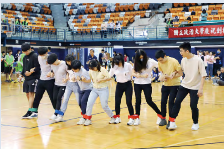
趣味競賽戰況激烈，教職員生共襄盛舉