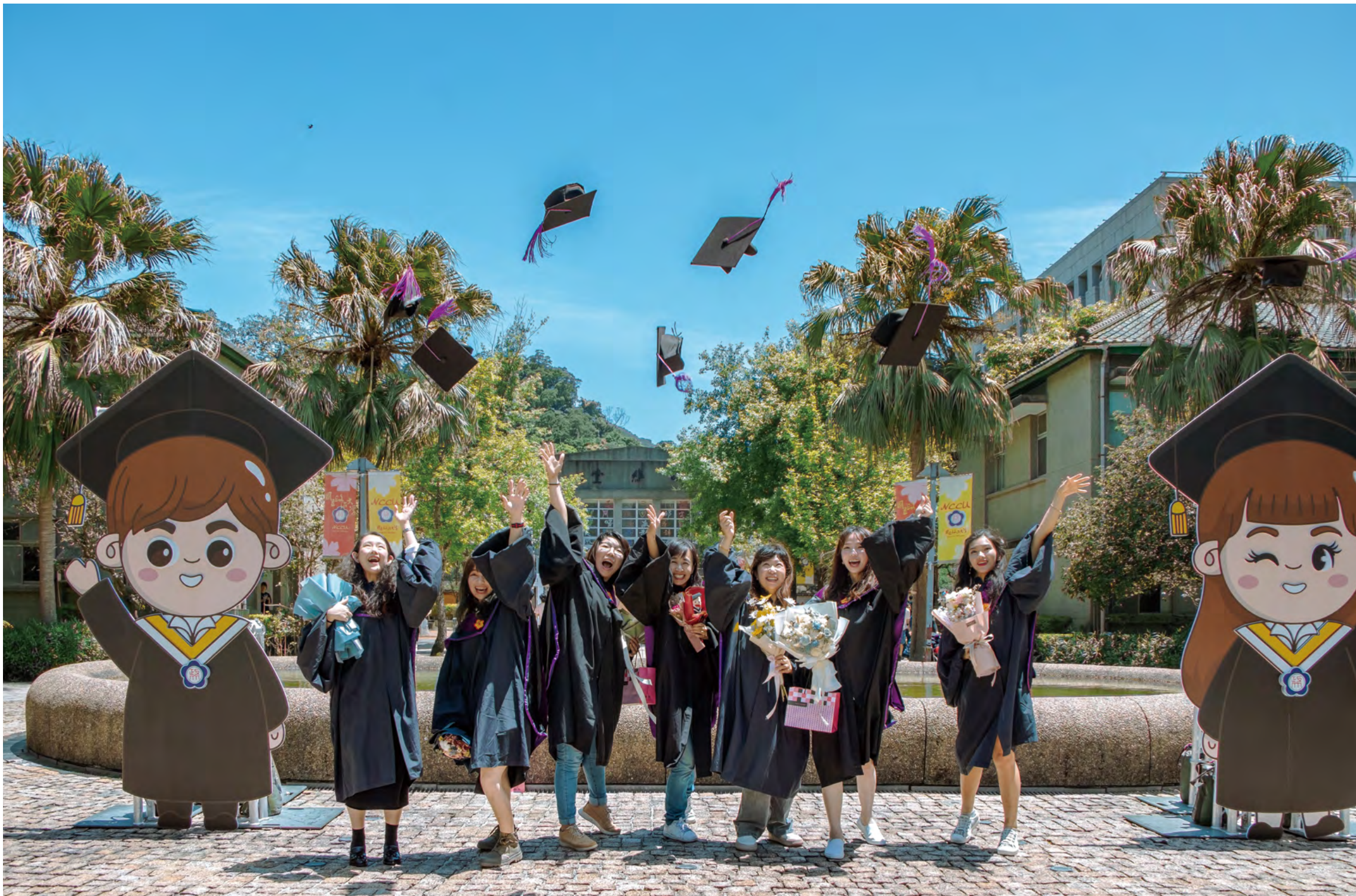
行管碩畢業生拿掉口罩，歡呼畢業快樂