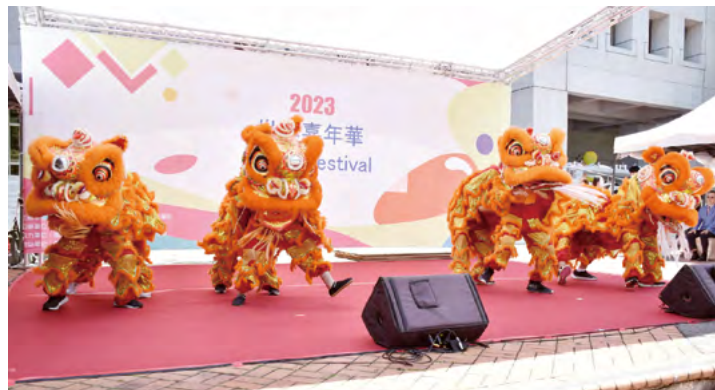
↑ The opening ceremony began with a lion dance performance from the Muzha Junior High School.