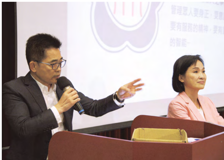
左上：政治進入大學講座第一場次由民眾黨主席柯文哲（左）率先與青年展開對話（照片來源：學生會） 左下：政治進入大學講座第二場次由時力主席王婉諭主講，談時力理念與青年政策（照片來源：學生會） 右上：政治進入大學講座第三場次由國民黨秘書長黃健庭（左）主講，國家政策研究基金會執行長柯志恩與談（照片來源：學生會） 右下：政治進入大學講座最終場由民進黨主席賴清德主講，與學生暢談未來願景（照片來源：學生會）