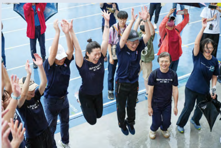
首屆跨界大隊接力賽師生不畏風雨開跑