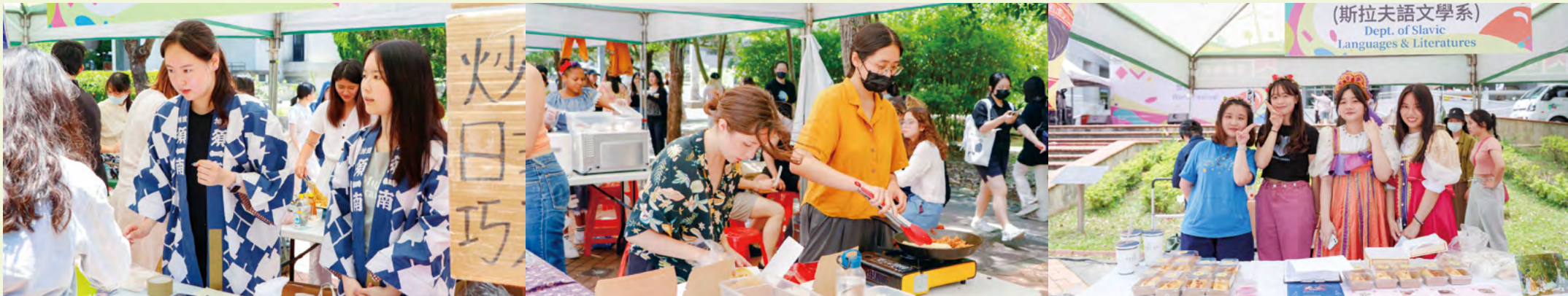
萬國食堂匯集各國美食，吸引不少人駐足