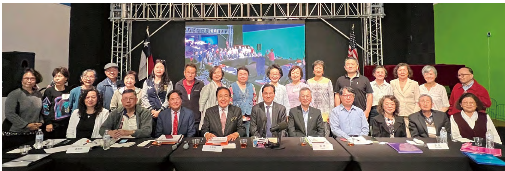
參與成立大會的校友會會長與各地校友代表們合影留念