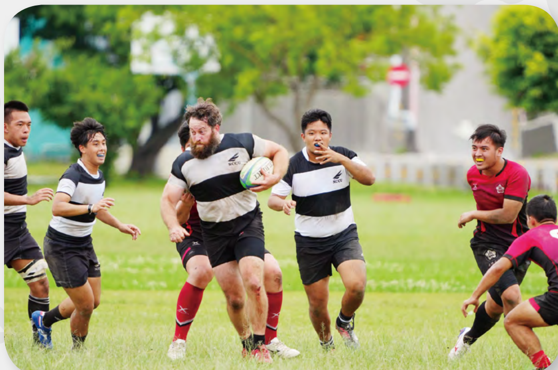
The program welcomes students who love sport culture.