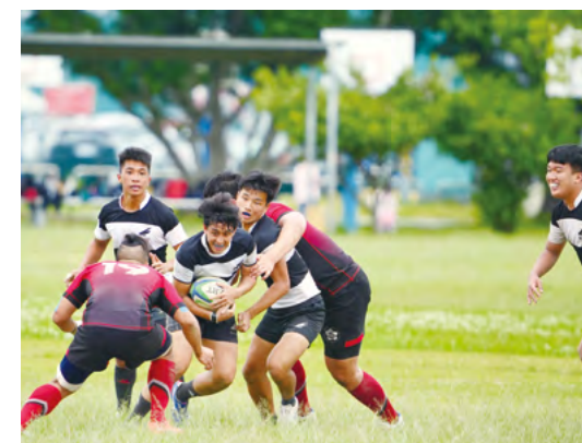
運動產業學程將於 112 下學期開始招生

呂潔如與孫秉宏都是體育系出身，知道體育專科的訓練內容，認為政大能發展出不同面向，兩人以「寶藏」形容校內充沛的研究量能，讓學生接受相當扎實的學術訓練。在人文、社科、法學、商學及傳播等領域，政大