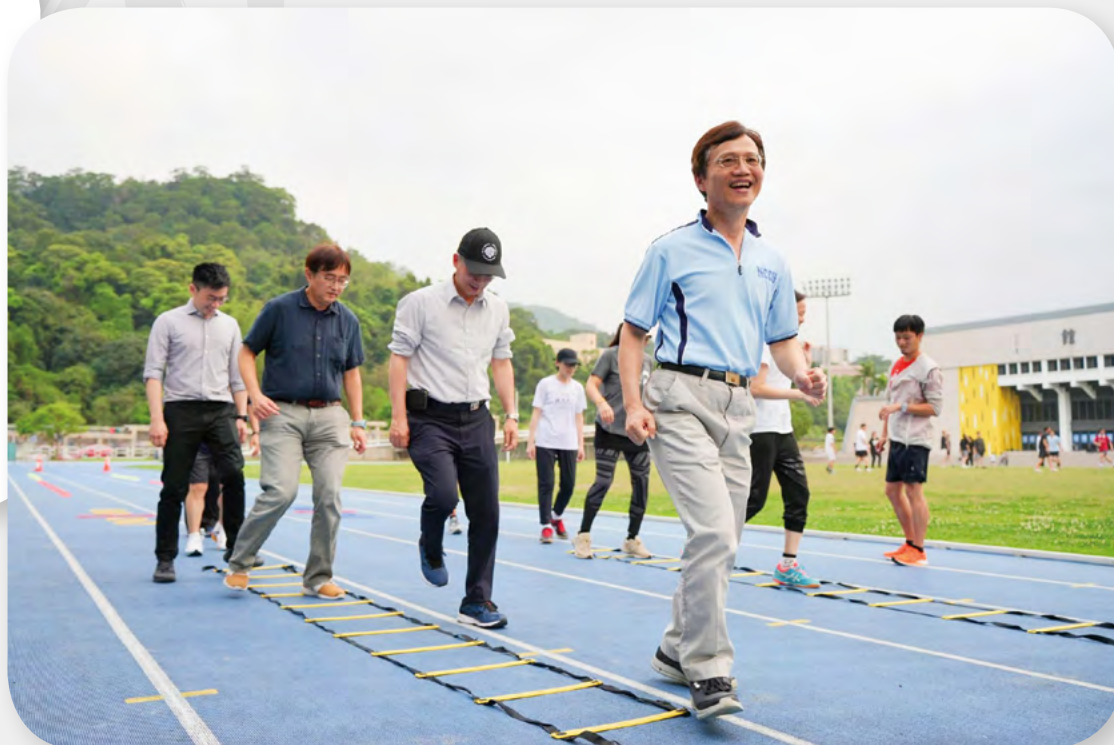
The president and senior staff practice sports in their spare time.