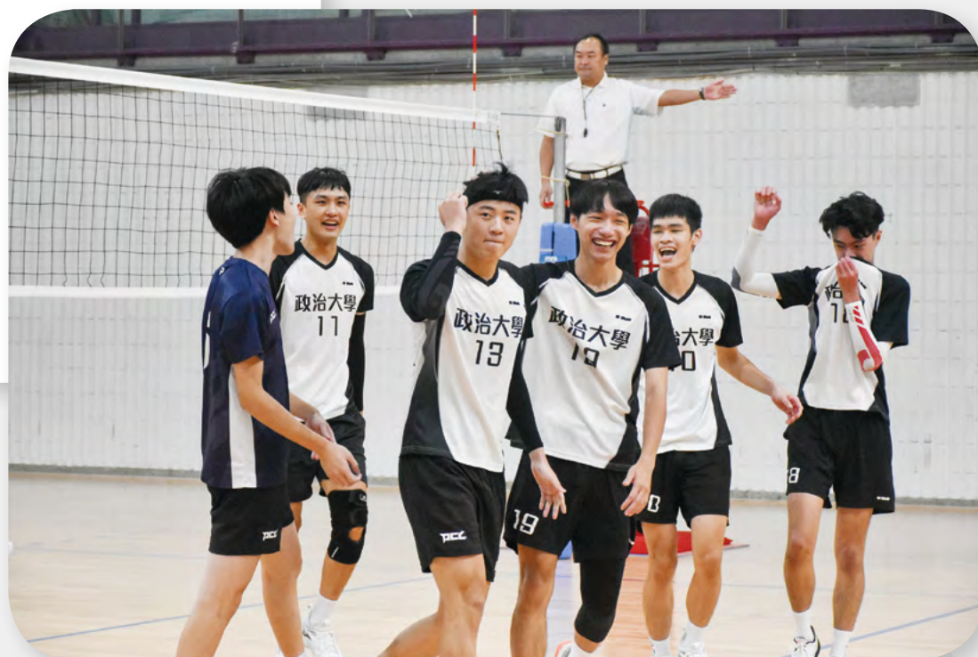
The Bachelor Program of Sport Industry and Culture is set to recruit new students in 2024.