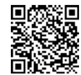
渡邊浩教授系列講座訊息

點，即使女性的「可愛」形象是由男性主導的文化價值觀所塑造，統計數據卻顯示，日本女性大多認同這種社會建構與性別結構，也自願履行在家庭和職場中的特定角色。