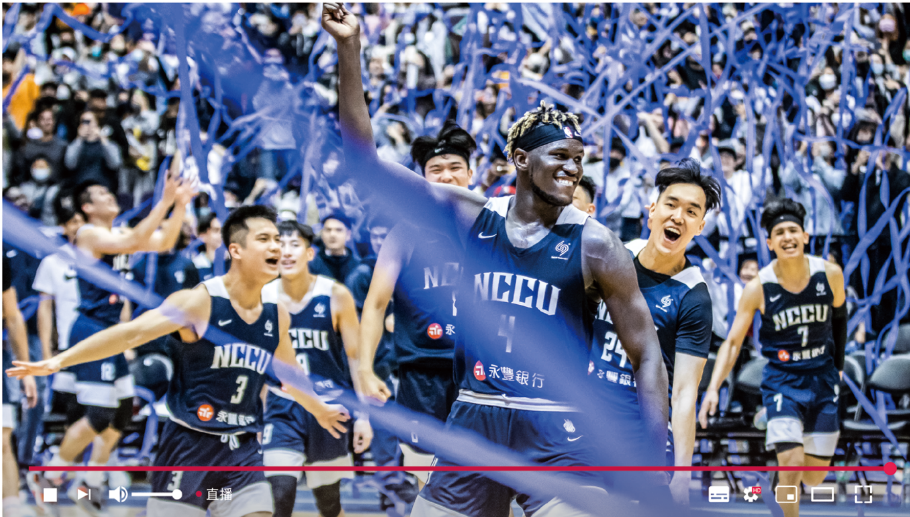
#政大雄鷹 #WeAreOne #鷹雄齊聚 #Cross #UBA #冠軍 #三連霸 #感恩惜福 #NCCU