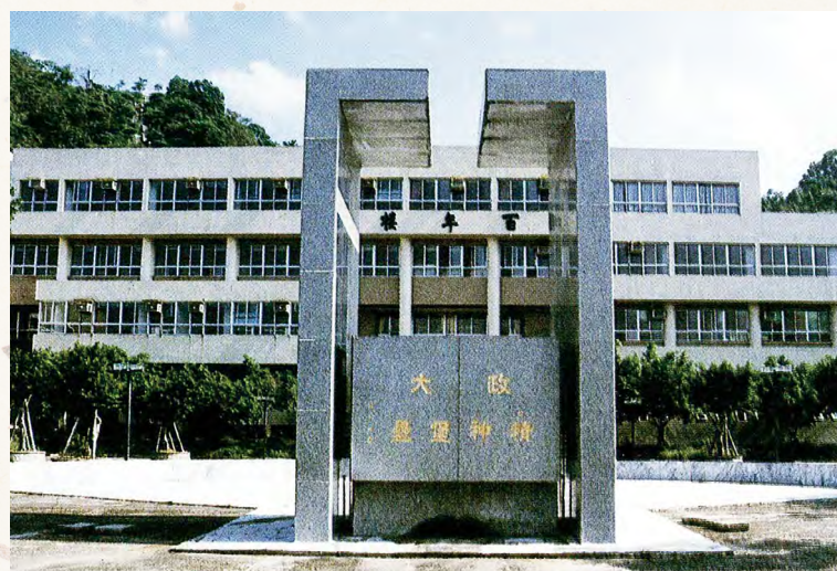
1992年時的精神堡壘

當初在四川與共軍交戰的第16、17、18期學長們，亦有不少人於是役中成功突圍，輾轉經香港先後來到臺灣。學長們在寄居他校完成學業後，於各領域皆有亮眼發展。正因為那段患難與共的同窗與袍澤情誼，以及對那些魂斷四川的同學們無法忘懷的情感，此三期學長們組成聯誼組織，希望能在母校政大的校園中，為那些英勇捐軀的同學們建立紀念碑，將這段歷史傳承下去。