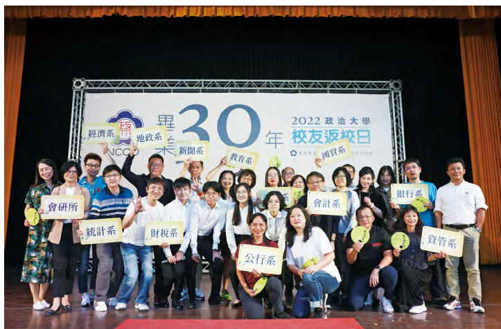
各系聯絡人用心召集班上同學返校，榮獲讚揚