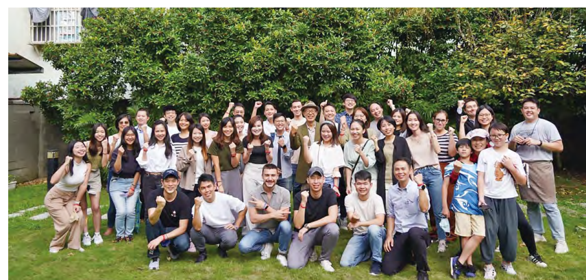
右圖：IMBA 大家庭於「校長的家」庭院合影留念