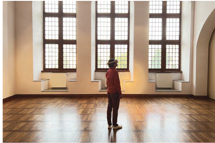
「自由人」計畫-虛擬分身機器同步連線波蘭調解雙年展及波蘭克拉克夫數位藝術節

「我們真的是雜牌軍。」陶亞倫分享，此計畫的主要執行者為兩位目前在工業技術研究院工作的政大校友、及四位在校學生，他讚許他們有清晰的思考與整合能力，「政大技術上沒有比別人強，但觀念很棒。」這同時也是政大數位內容學程的優勢，不同於藝術或理工專業的學校較為偏重藝術或科技，政大整合資訊科學系與傳播學院的專業，將數位科技結合人文學科，不只是專注於發展科技，同時也以批判觀點思考科技對人類的影響。