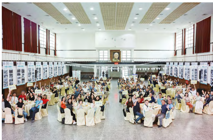
畢業 30 年校友返校日大合照