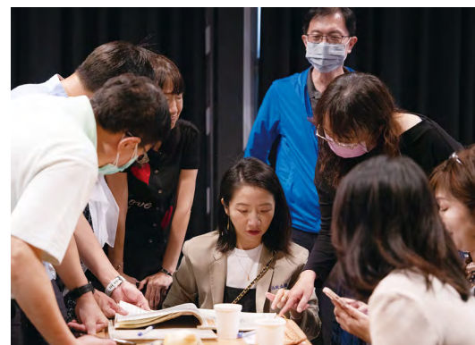
新聞系校友圍看當年的《柵美報導》

如今身兼主持人、歌手與作家等多重身分的陶晶瑩，也鼓勵學弟妹多方面學習，嘗試探索學習的好玩之處，「Work hard, play