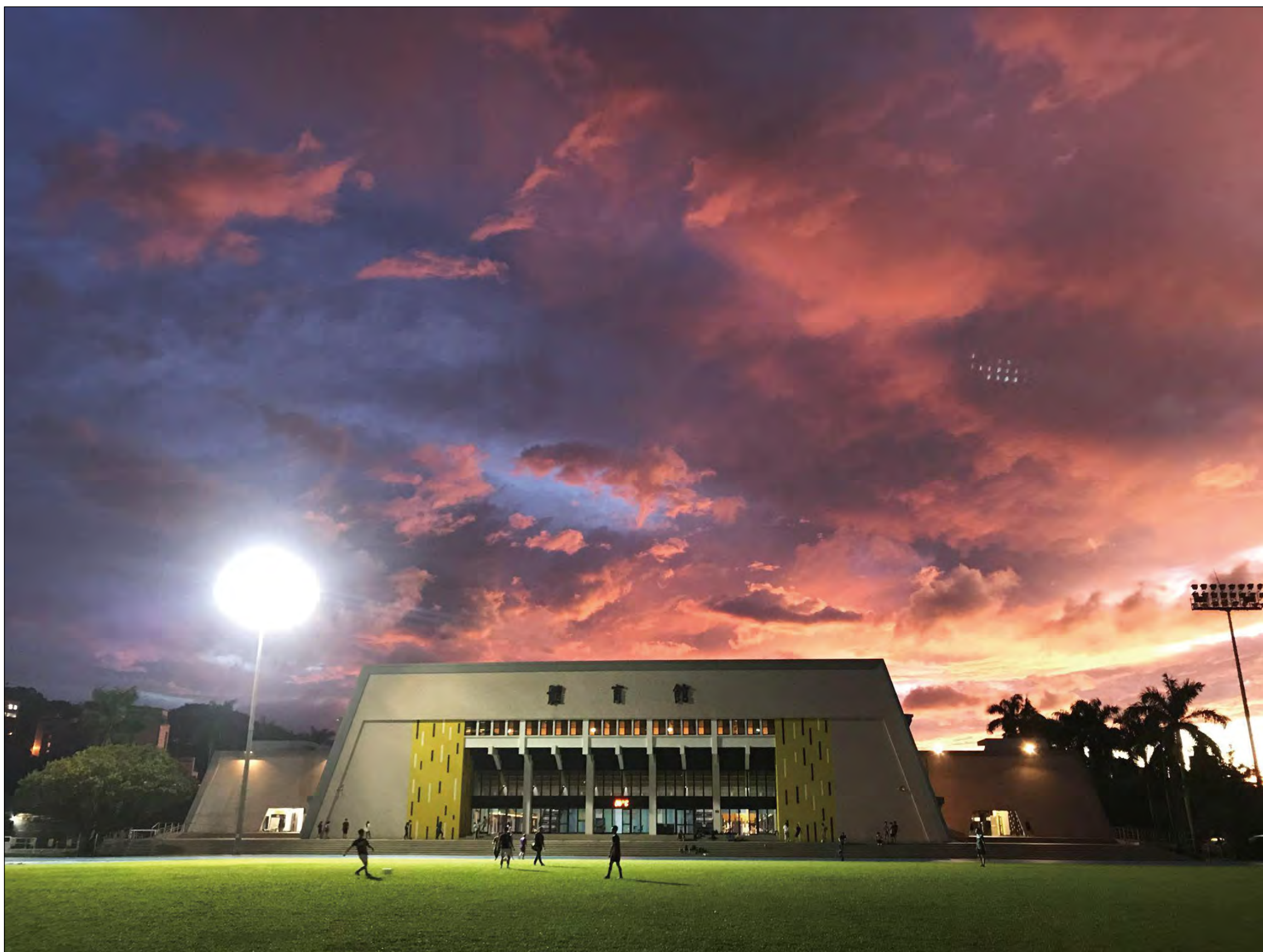
封面獎 | 政大人組 |