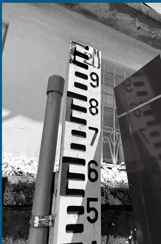
隱身草叢的水標，是對政大淹水歷史的見證。

景美溪經過整治後，政大逢雨則淹的景象已不復見。曾經用以測量水深的水標尺自然失去其用武之地，如今靜靜地佇立於草叢中，凝望著麥側熙攘穿梭的人潮，以它斑駁的身軀默默地提醒人們，政大那段曾與淹水密不可分的歷史。