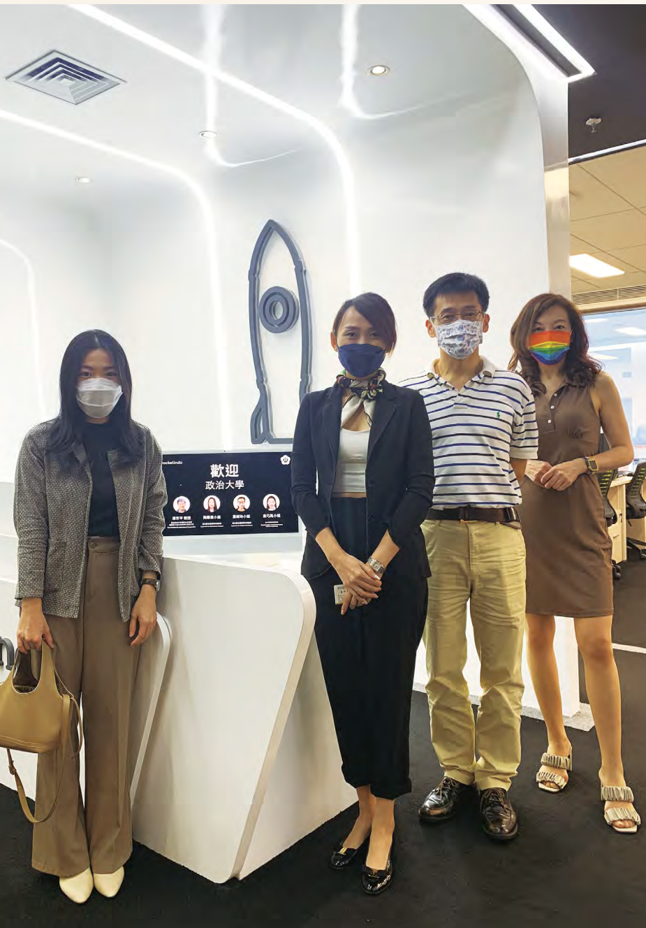
The NCCU team visited Rocketindo, which is known as the “cross-border e-commerce enabler” in Indonesia. The brand has stated that they are ready to embrace talents from Taiwan.

TO DRIVE NEW SOUTHBOUND HIGHER EDUCATION POLICY.