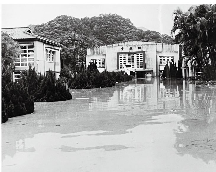
四維堂前淹水畫面（堂前閃電型校徽時鐘為 1982 年畢業校友贈與母校）