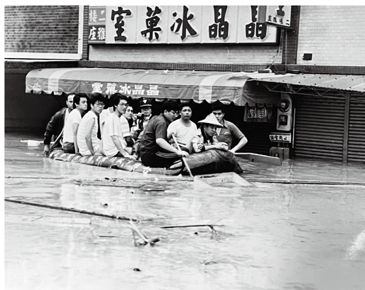
師生搭乘橡皮艇逃生畫面（晶晶冰菓室，現址為校門口路易莎、cowbanana 一帶）