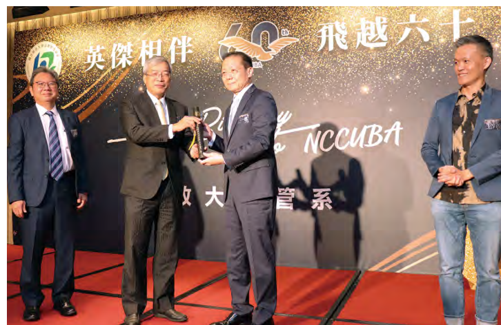
左圖：政大企管系歷任系友會會長、師長與歷屆聯絡人一同合影（照片來源：企管系） 右圖：系友會交棒，傳承企管榮耀（照片來源：企管系）