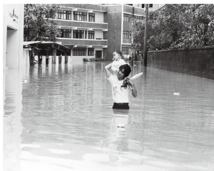
派出所前道路淹水畫面（左方白色建築為今指南派出所，前方建築為今吉品牙醫診所）