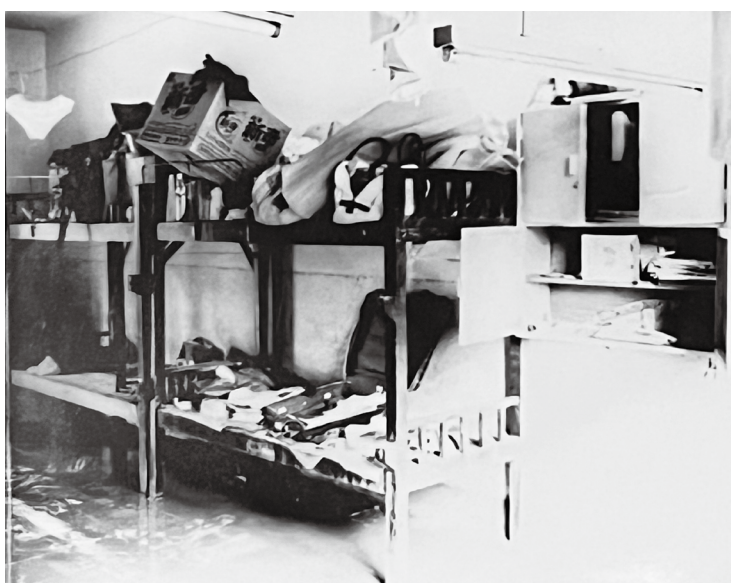
當年宿舍淹水畫面