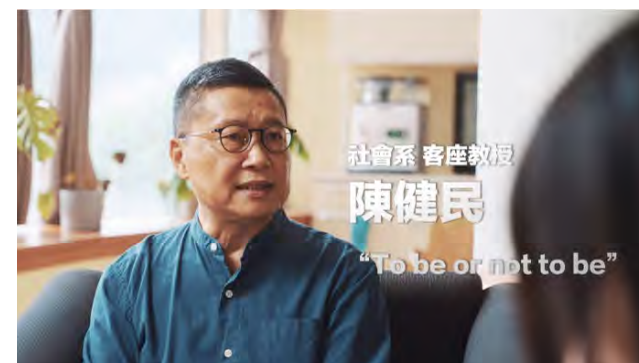
左圖：社科院院徽的火箭外型，期許師生在學術研究或探索自我時勇於冒險，不輕易妥協（照片來源：社科院） 中圖：社科院形象影片，將社科人核心精神貫穿其中（照片來源：社科院） 右圖：香港佔中運動發起人、客座教授陳健民於影片中鼓勵社科人投入、承擔生命的道德責任（照片來源：社科院）