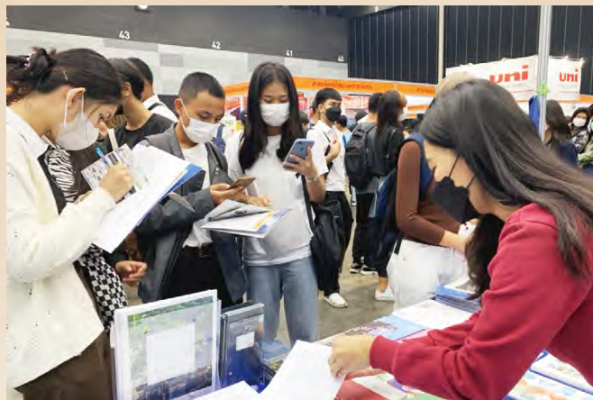
Students reveal high level of interest on overseas study in Taiwan and lots of them have visited BITEC Educational Exhibition(DEK-D TCAS).

The trip to Thailand was profoundly fruitful. In addition to discussing the development of teaching and research