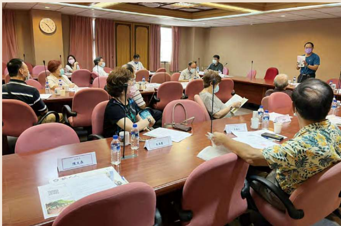
各系聯絡人討論紀念輯編輯方式