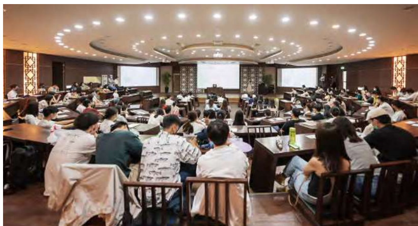
學長姐輪番上陣，分享大學求學經驗 (照片來源: 文學院)