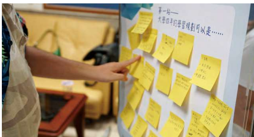
新生寫下對未來的規劃與期許