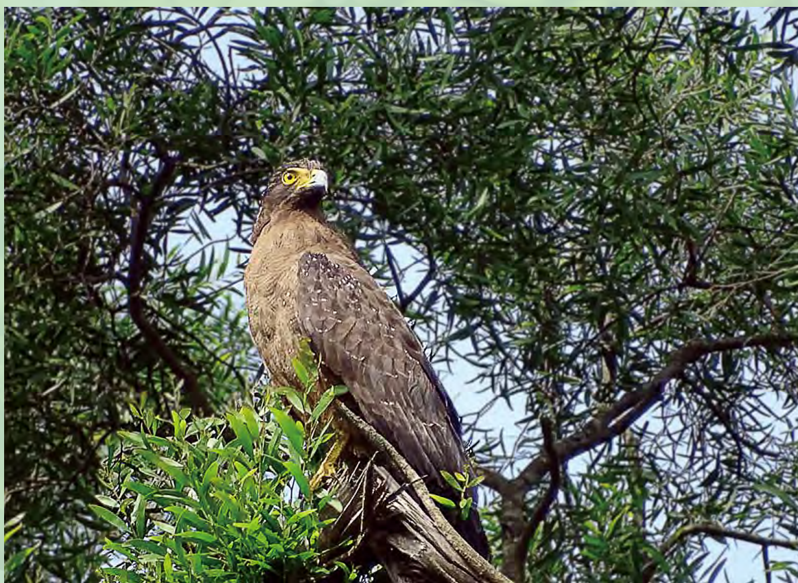
大冠鷲的英姿