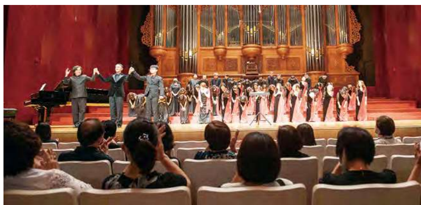
政大校友合唱團以歌聲詠懷生命，為逝者與生者祈福

今年是校友合唱團特別忙碌的一年，1 月初南下高雄，與臺南山嵐合唱團共同在衛武營國家藝術中心舉辦「生之讚頌」音樂會；3 月與政大校友青年合唱團在臺北聖家堂舉辦「聲聲不息」音樂會，展現政大合唱音樂香火傳承。6 月與青韻合唱團及諧之聲男聲合唱團一起登上國家音樂廳舞臺，應邀