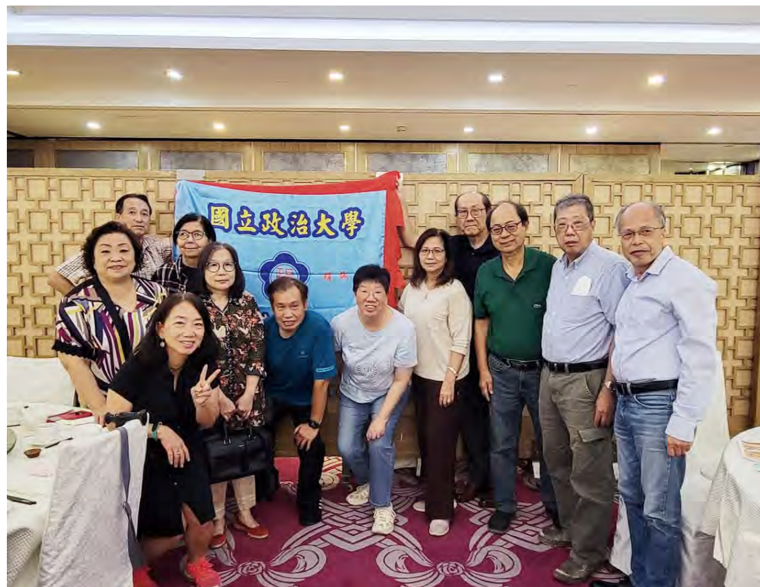
香港校友會茶聚合影