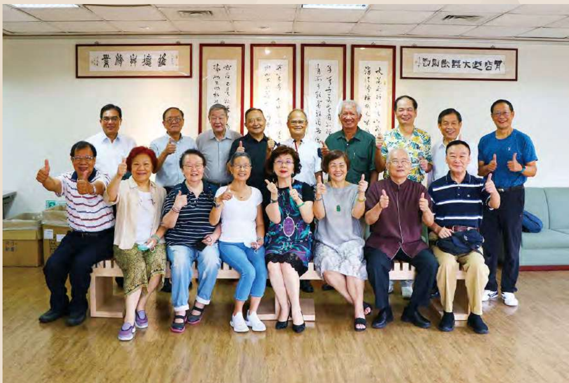
第 33 屆畢業 50 年紀念輯聯絡人合影