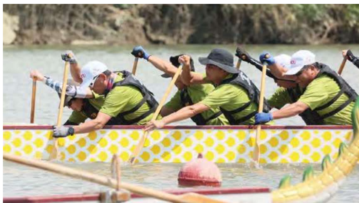
每一隊都卯足全力，奮力前划