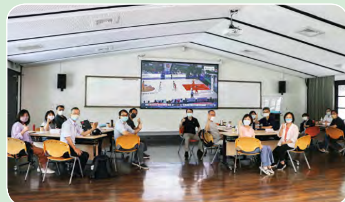
晚上也不忘為遠在日本比賽的雄鷹籃球隊加油打氣。