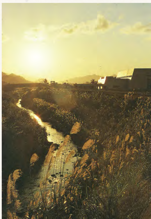
民國 77 年醉夢溪畔