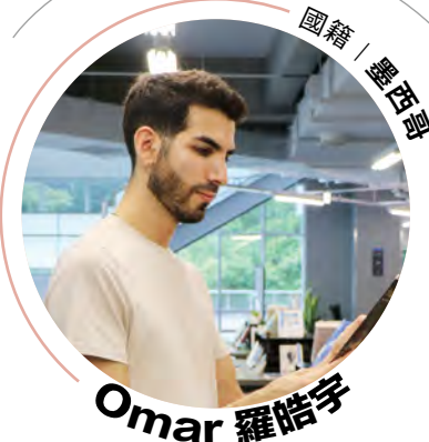
國際研究 英語碩士學位學程 一年級