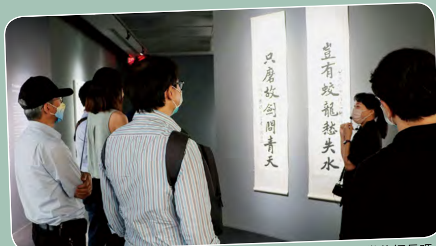
猜一猜，從背影可以看出是哪幾位師長嗎？