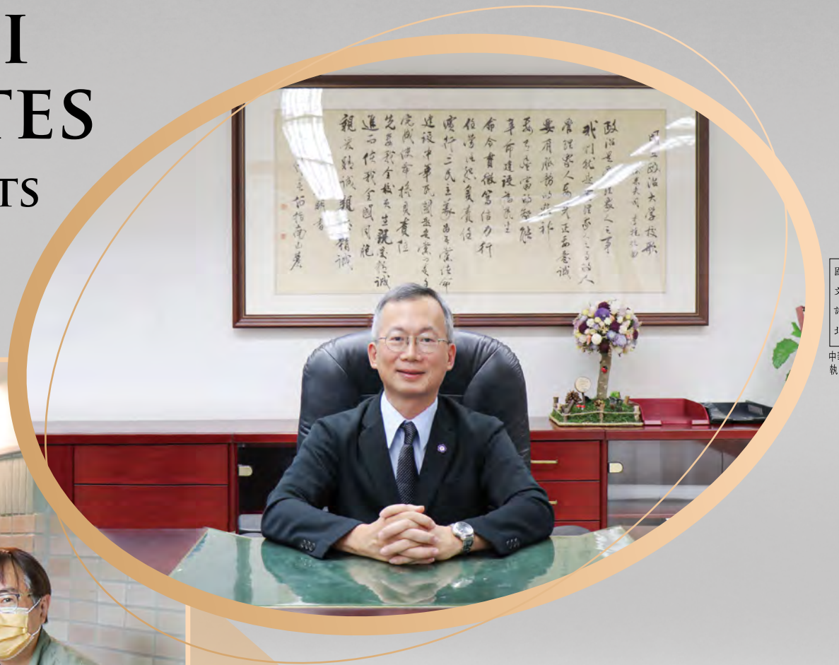
國內郵文山指許可北台字第中郵政台北台執照登記