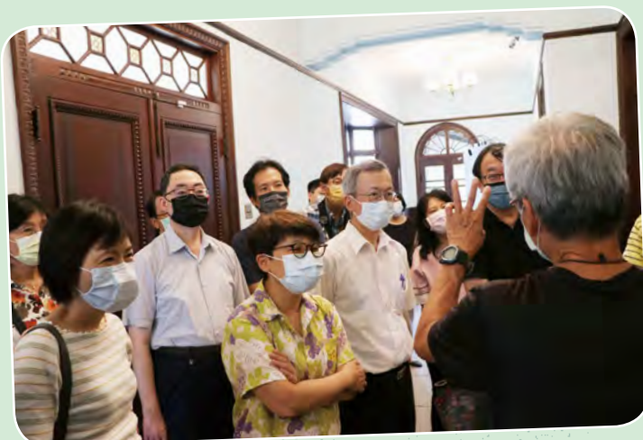
師長們專心聆聽導覽。