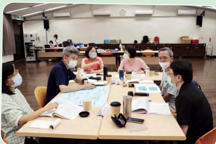
分組討論、熱烈交流中。