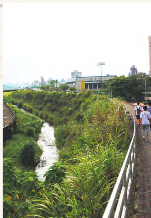
今日的醉夢溪景色依舊，悠悠學子漫步於河堤