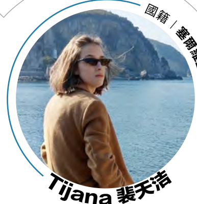
國際研究 英語碩士學位學程 一年級