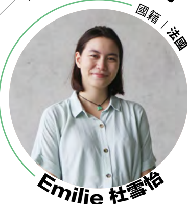
國際經營管理 英語碩士學位學程 一年級