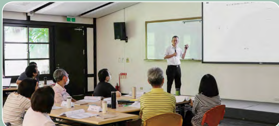
大家聚精會神地聽報告中。