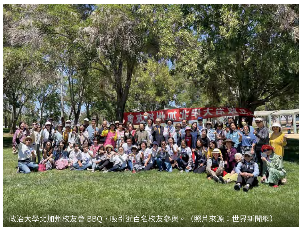
政治大學北加州校友會 BBQ，吸引近百名校友參與。

為慶祝校慶，會中也特別設計「注酒儀式」，邀請貴賓將紅酒倒入「NCCU 95」冰雕內，臺下舉杯齊賀「政大九五、世界翹楚」，祝福政大往頂尖之路耀耀前行。最後，本次活動在全場齊唱校歌的悠揚樂聲中，劃下圓滿句點。