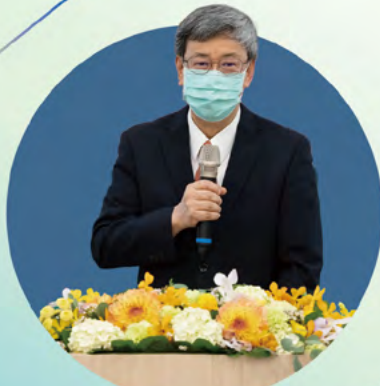
前副總統陳建仁到場恭賀，表示對國際金融學院發展寄予厚望

李勝彥於致詞時感謝業界各方好友到場應援，並悼念日本首相安倍晉三之辭世，以 2004 年電影《明天過後》作為引言，期勉在場學院新生及後輩在艱困中找到力量，明天過後依然看到破曉曙光，並鼓勵學生們妥善運用學院給予的環境妥善學習，培養知識力，向各方產學優秀菁英學習。他更指出：「產學納入重點，就能夠來引導產業界，用知識能夠去解決一些問題。」觀光、科技、金融為臺灣未來經濟發展的重點領域，臺灣在半導體產業界領軍世界，在國家產業政策之驅動下，國際金融學院與半導體學院之成立將是未來產學雙融，輸出兩大產業所需的優質國際級人才、成為活絡國家產業命脈、推動產業創新的孵化中心。