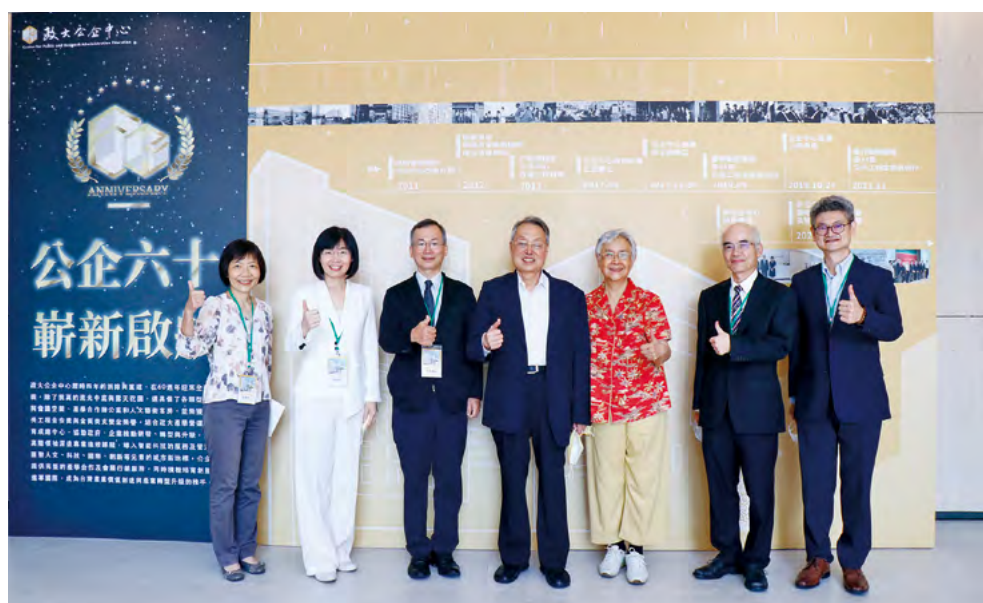
慶賀公企中心六十周年感恩茶會，施振榮伉儷（中）特地到場致賀