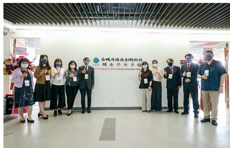
揭牌典禮出席貴賓師長合照