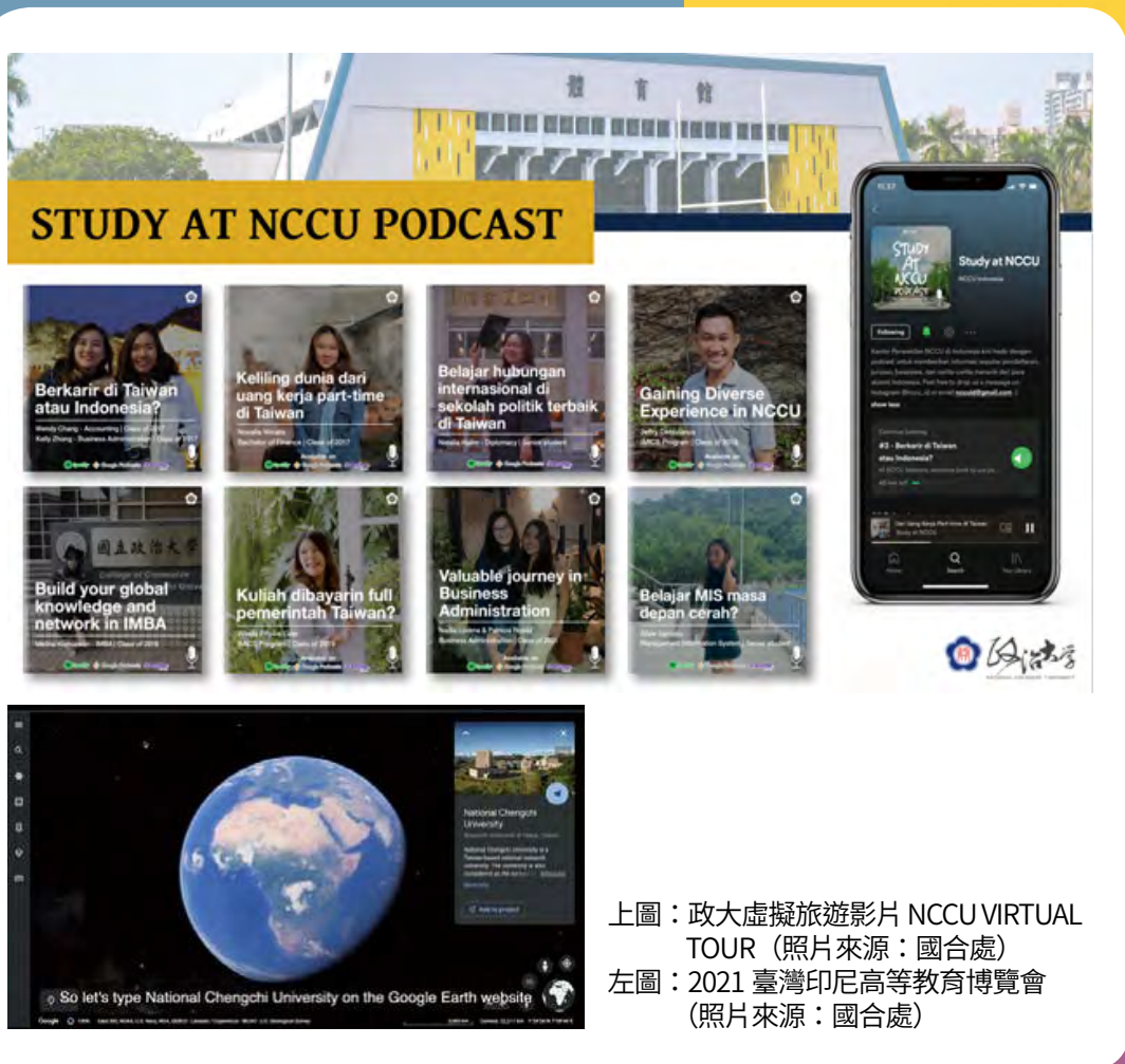
上圖：政大虛擬旅遊影片 NCCU VIRTUAL TOUR (照片來源：國合處) 左圖：2021 臺灣印尼高等教育博覽會 (照片來源：國合處)

為跨足國際、拓展海外招生市場，及吸引新南向國家優秀學子，政大兩年內已陸續成立泰國、印尼兩大據點，後續亦規畫成立越南及印度兩處辦事處，希望透過多據點相互支援，並藉助政府新南向政策的量能與資源，為政大海外招生與宣傳開拓更寬廣的道路，吸引更多優秀外籍生前來政大就讀。