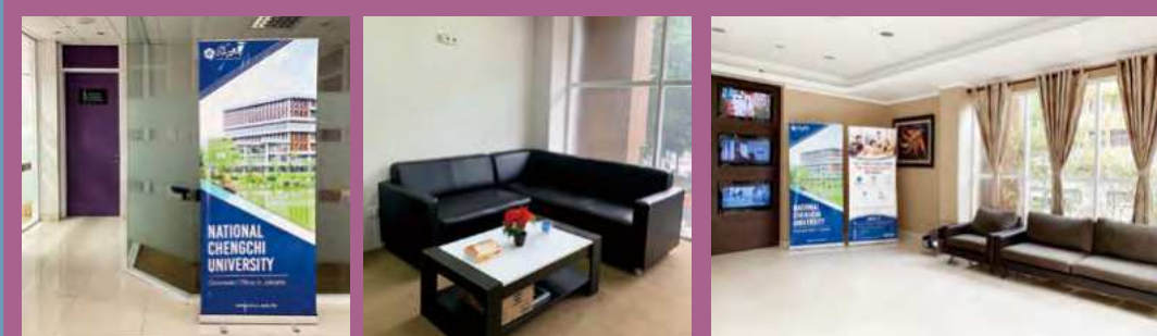
目前印尼辦事處已設立完成，環境舒適明亮