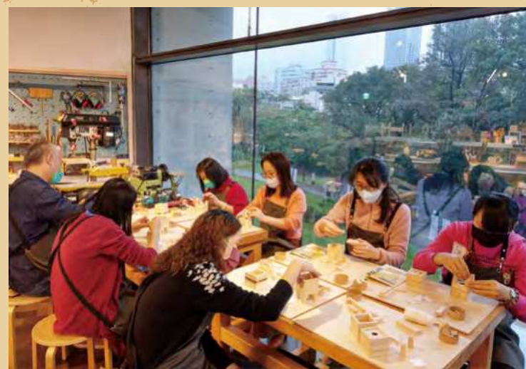
上圖：學員細心地替盆栽黏上零件，依照喜好裝飾（攝影：秘書處） 左圖：學員與自製動物盆栽合影留念（攝影：秘書處）