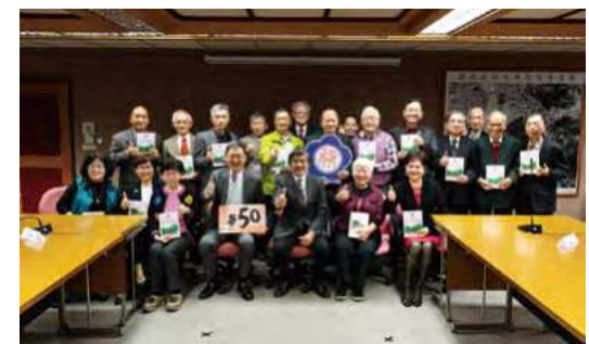
畢 50 各系代表與精心編纂的紀念輯合影