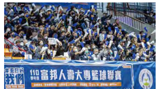
上圖：看台上的球迷手持雄鷹專屬加油棒，整齊劃一地為選手吶喊