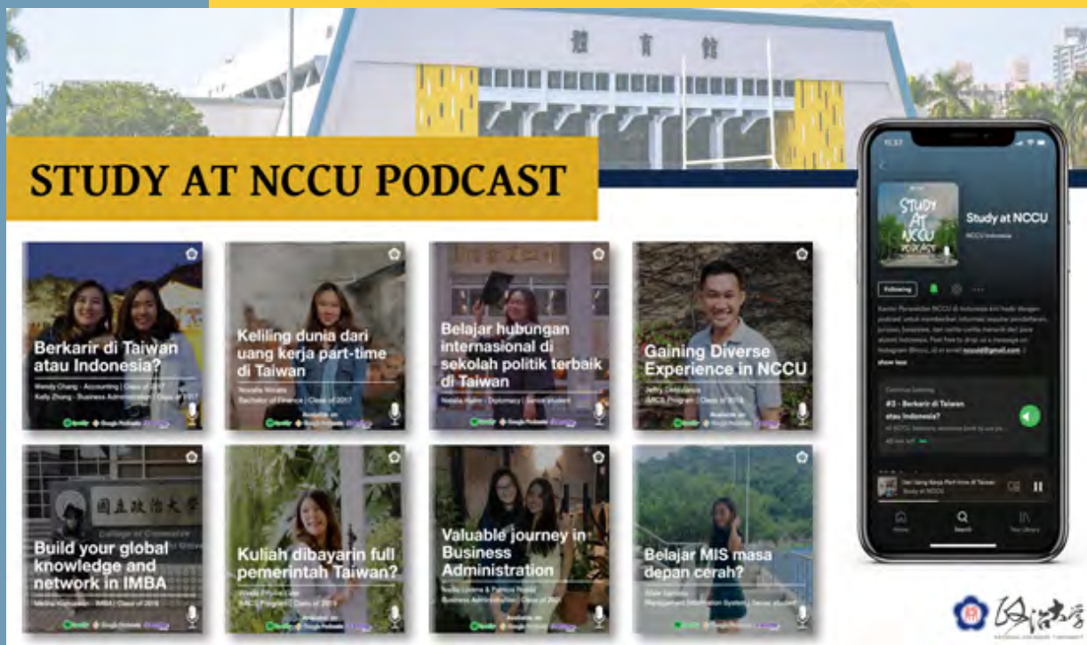
NCCU VIRTUAL TOUR

Taiwan universities are attracting increasing numbers of overseas students from Southeast Asia, and the number of applicants from Indonesia has been rising steadily. According to the Ministry of Education, in 2020 Taiwan hosted over 90,000 international students, 14,000 of whom are from Indonesia, making Indonesia one of the most important sources of international students in Taiwan, behind only Vietnam and Malaysia. Despite the challenges presented by the global pandemic, National Chengchi University is actively seeking to attract more outstanding Indonesian applicants. In November 2020, NCCU established a virtual representative office in Jakarta. The mission staff collect local intelligence on higher education, while disseminating information on admissions procedures, university admissions and pandemic prevention. Due to COVID-19, the office's official opening was delayed until January 2022. When open, the representative office will provide local students and their parents with critical information about NCCU and local services, and will also provide networking services and activities for NCCU alumni.