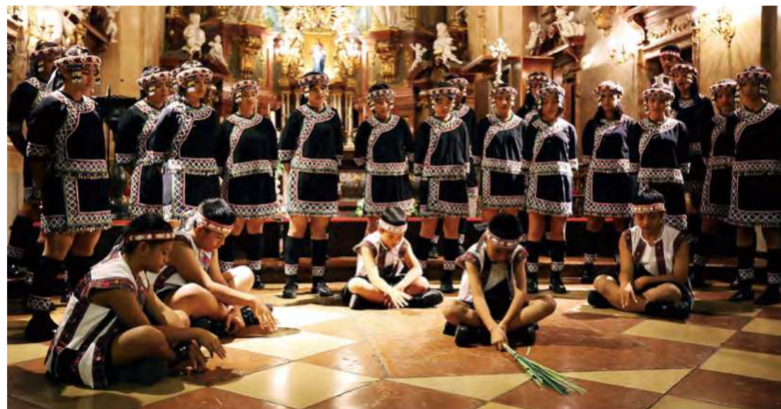
原鄉榮耀，聲挺南島。2/12 國父紀念館大會堂與您共享天籟