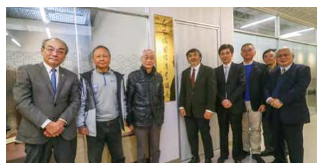
漢學大師余英時院士親書「羅家倫國際漢學講座」揭牌儀式，由校長郭明政（左四）主持，會後現場貴賓、師長合影

最後，由黃進興祝福政大，期許政大所有的講座皆能產生具有指標性、方向性的引導作用，引起大家的重視，成為學術界整體的成果，期許能從下一代的年輕學者並看見收成。