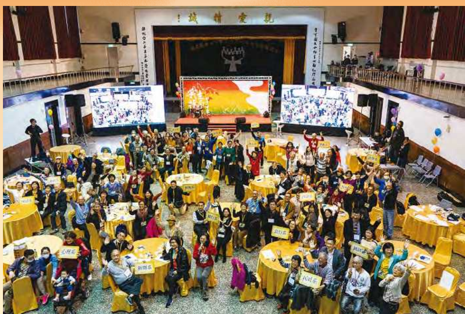
校友大合照，為這次寶貴的重逢留下紀念