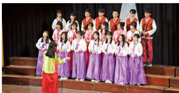
韓文系穿上特色服飾演唱 SHINee 的歌曲〈Stand by me〉，成為現場矚目焦點

上半場的八個隊伍中，不少隊伍结合自身系所特色，用歌聲與音樂傳遞深厚意涵。英國語文學系透過歐美世界家喻戶曉的名曲〈Hallelujah〉，對文化盃致以崇敬的讚美，並由指揮莊家璋重新編曲，融入阿卡貝拉、無人聲伴奏及藍調元素，為經典歌曲賦予新意；韓國語文學系身穿特色服飾，以韓國偶像團體 SHINee 的歌曲〈Stand by me〉，與聽眾共享愛情的青澀與甜蜜滋味。