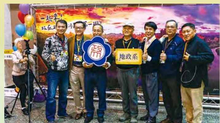
校友與政大的河堤美景合照