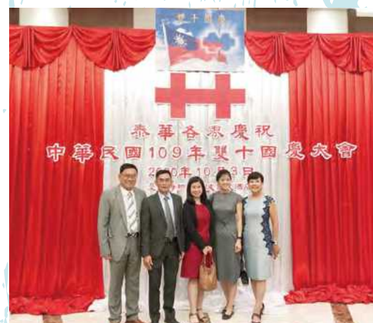
2020/10/03 與僑界及校友歡慶國慶