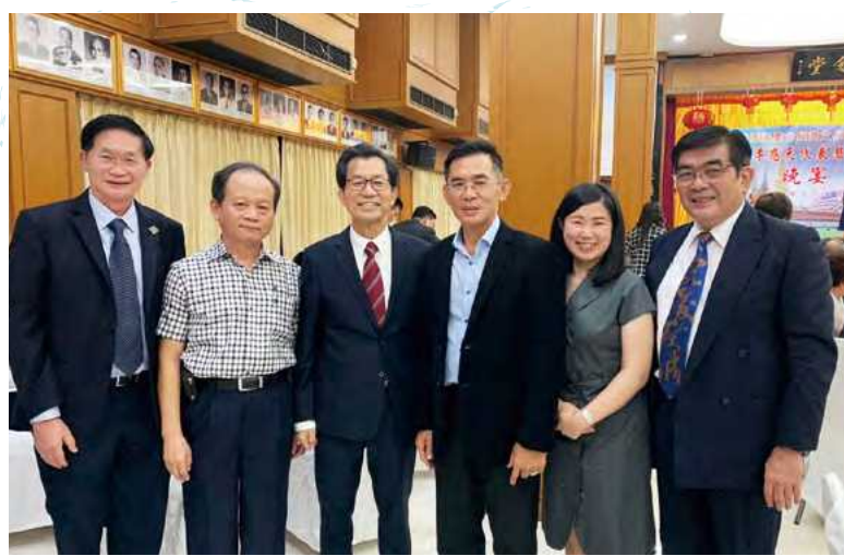
2020/09/11 參加校友會宴請前大使李應元晚宴

為每一位潛在學生提供最直接的服務，並藉由校友分享在校求學經驗、校園生活與報考建議等，深化網路資訊之豐富性；此外，泰國辦事處亦積極參與泰國當地校友活動，如歡慶本校94週年校慶餐敘及國慶慶典，並與海外辦公室、秘書處共同拍攝校長致泰國校友校慶影片等等，強化校友與本校的互動交流。在二位駐地人員的努力下，使得本校110學年泰、印二國國際招生成果斐然。以泰國學生為例，報