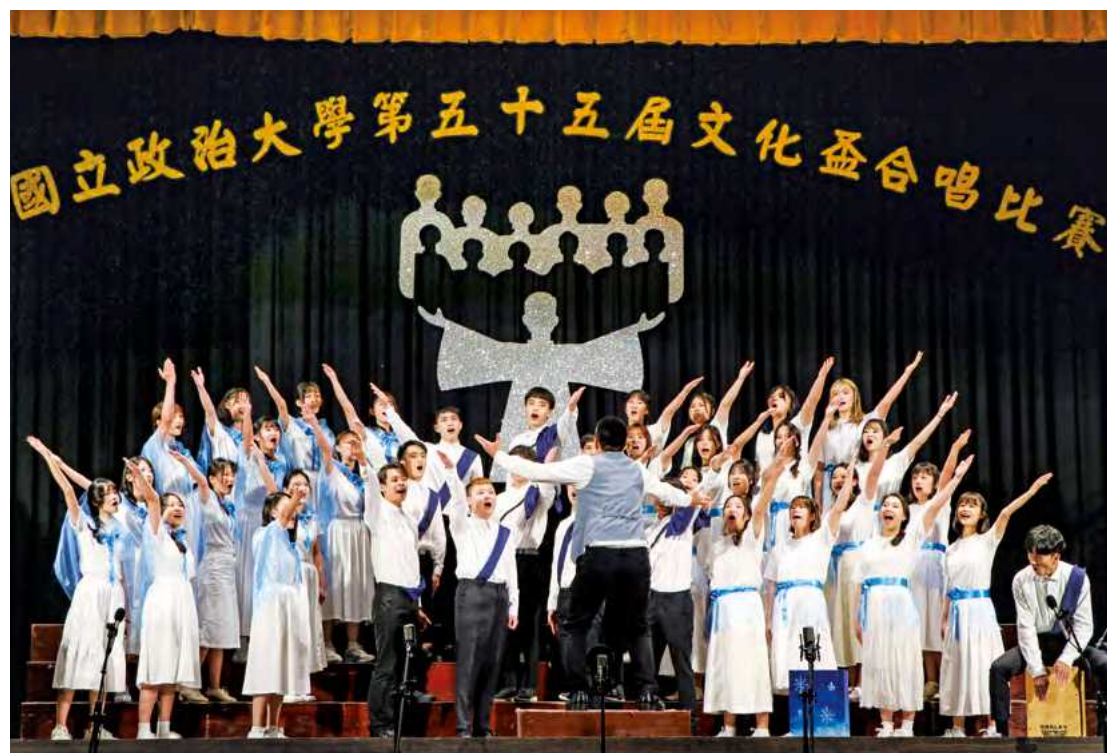
傳院一大二不分系今年再度奪下冠軍，是本屆文化盃最大贏家

授的小撇步令人印象深刻，「當主旋律出來，他會說就像要端牛排主餐；若同一個段落太衝，他又會說別忘記主餐前還有開胃菜。」生動的比喻讓練習增添一些有趣的色彩。