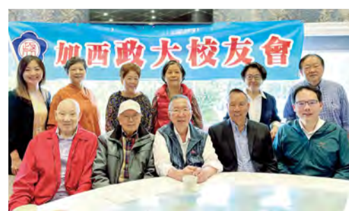
加西政大校友會選出新理事會