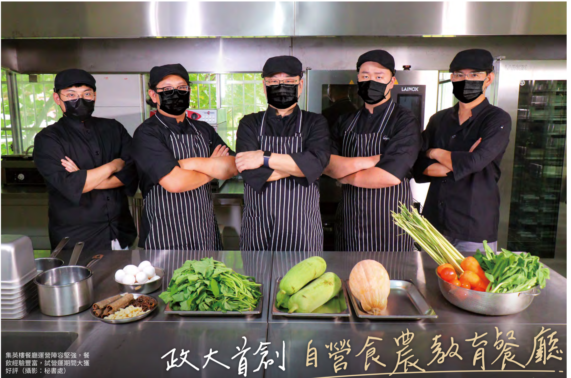
集英樓餐廳運營陣容堅強，餐飲經驗豐富，試營運期間大獲好評