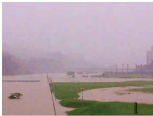
2012 年泰利颱風侵襲，政大堤外淹水照片

2000 年 11 月鄭校長上任，是我當選學生會第一屆會長後 5 個多月。他就職當天，象神颱風造成木柵地區大淹水。典禮結束後，我們就站在行政大樓門口，透過校內電話，解決我替同學提出的應變問題。