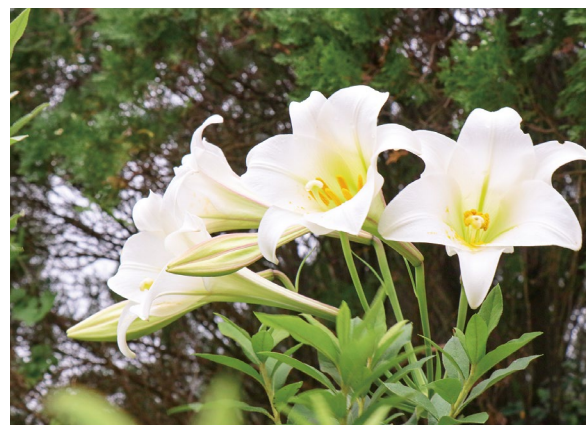
上圖：國際大樓旁百合花盛開 右圖：8月中於新北石碇－磨石坑拍攝之艷紅鹿子百合