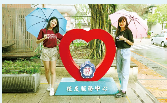
紀念品中心打卡地標，象徵著校友服務的用心與包容

緋紅愛心如臂彎般擁抱著紺青色校徽，象徵著校友服務的愛與包容。這是政大校友服務中心的地標，也是校內人氣打卡地點。紀念品中心亦位於正門口右手邊，是入校量測體溫後的必經之地。小而美的空間內，陳列著許多富含政