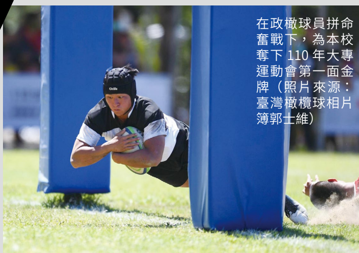
在政橄球員拼命奮戰下，為本校奪下 110 年大專運動會第一面金牌

本次橄欖球大專盃於成功大學舉辦的全大運一併舉行，橄欖球項目分成 7 人制與 15 人制，前後賽期達 12 天，對於體力、耐力與後勤支援都是相當大的考驗。政大預賽與地主成功大學以及海洋大學等兩所強校分在同組。由於去年（109 年）疫情停辦之故，本屆賽事也是兩年來各校在大專盃的首次碰頭，政大展現過去一年多來訓練