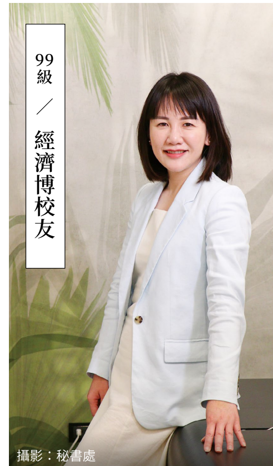
99 級 經濟博校友

最後，謝衣鳳想建議學弟妹依循自己的興趣：「一定要找到自己喜歡的事情，如果遇到困難，不要害怕！」她解釋，社會上很多工作都會面對困難、挑戰和壓力，但為了自己很喜歡的一件事，再辛苦都不會感到害怕，就像她在立委工作上遇到的挑戰再艱難，謝衣鳳仍會堅持為民服務，也算是為了自己想做的事情持續邁進。