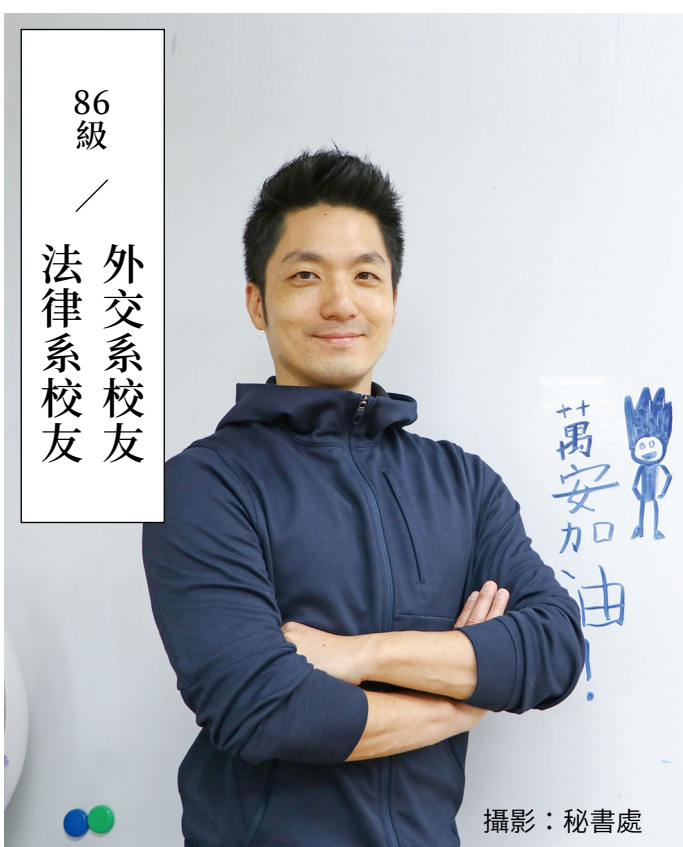
86 級 外交系校友 法律系校友

談及未來計畫，蔣萬安說：「不管在哪个崗位上，把本分做好都是很重要的事。」除了持續為弱勢發聲，他也不會迴避責任，以回應民眾的期待。