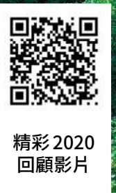
精彩 2020 回顧影片