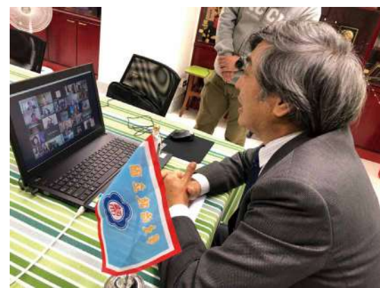
上圖：北加校友會 2020 送舊迎新雲端音樂雅集，近百位校友線上聯歡