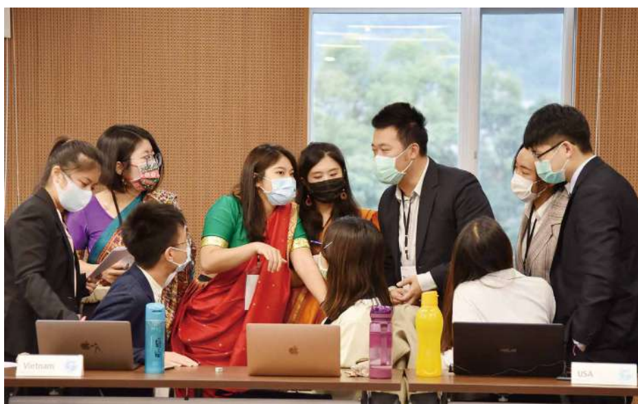
學生於「政大世界衛生組織模擬」會議中分別扮演世界衛生組織及各國代表，演練如何處理疫情難題

色致力培育具全球性視野、跨領域知識學習能力的菁英人才。創新國際學院獨創「專題研究」課程，除「全球衛生治理」與「人類世與地緣政治」外，開設課程也觸及AI與倫理、大數據與假新聞、移民與全球化、永續在地全球化等多元課題，歡迎全校同學踴躍選修。學院同時承接南島論壇與大學社會責任計畫，強調與各院以及國際的合作連結。