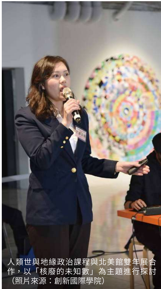
人類世與地緣政治課程與北美館雙年展合作，以「核廢的未知數」為主題進行探討

情時代的國際協議。而「人類世與地緣政治課程」則結合臺北市立美術館雙年展，舉行核廢料協商劇場，引導學生透過换位思考深度探討環境議題，關注社會議題與人文變遷。