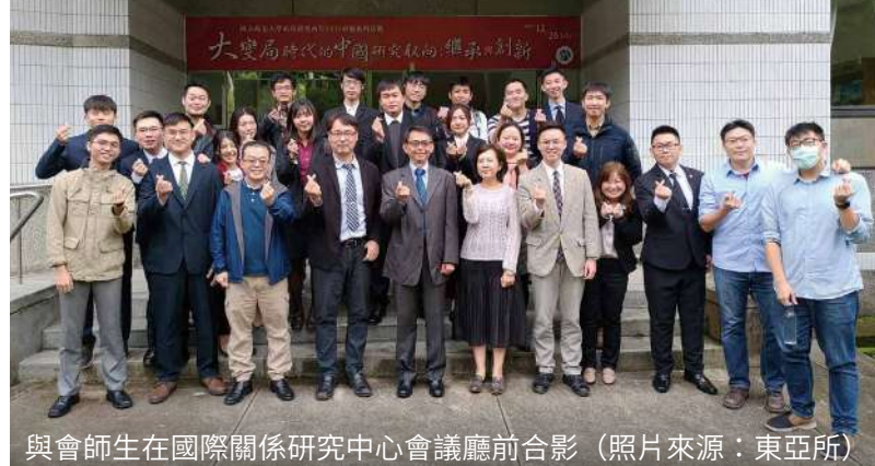
與會師生在國際關係研究中心會議廳前合影