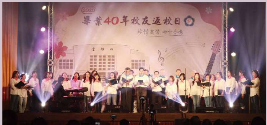
上圖：畢40財稅系校友領唱經典民歌