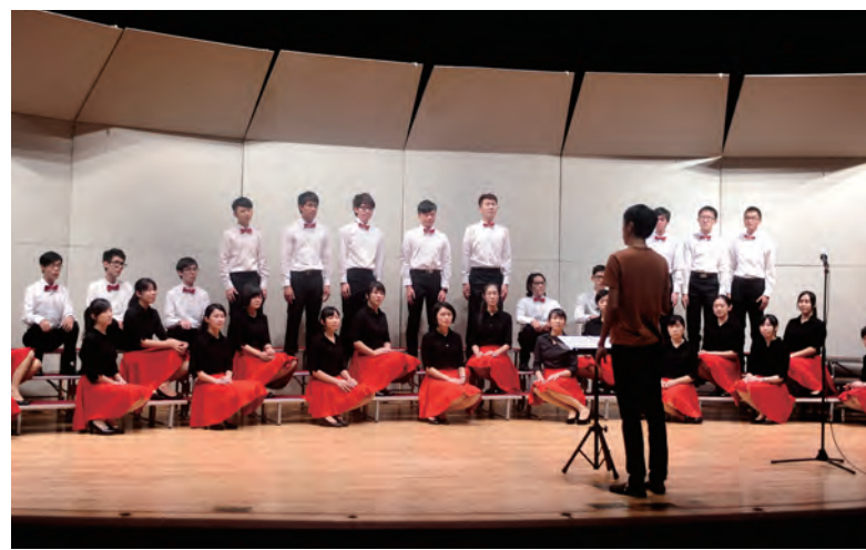
▲振聲合唱團應邀參與台北國際合唱藝術節演出

【學務處課外組訊】受台北愛樂文教基金會邀請，振聲合唱團7月26日晚間登上今年度台北國際合唱音樂節舞臺，和美國卡第諾歌手合唱團(The University of Louisville Cardinal Singers)聯合演出，與臺下觀眾共同分享合唱音樂的美好。