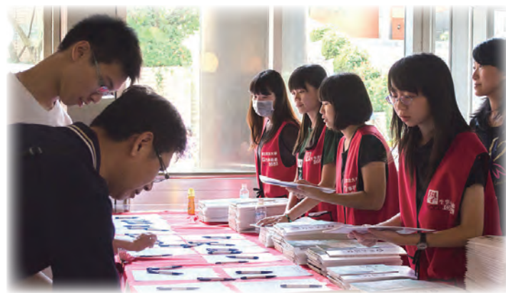
▲學務處每年舉辦親師座談，許多家長積極參與。