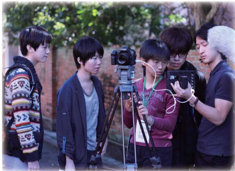
▲廣電系同學實機操作拍攝，提早和產業接軌。