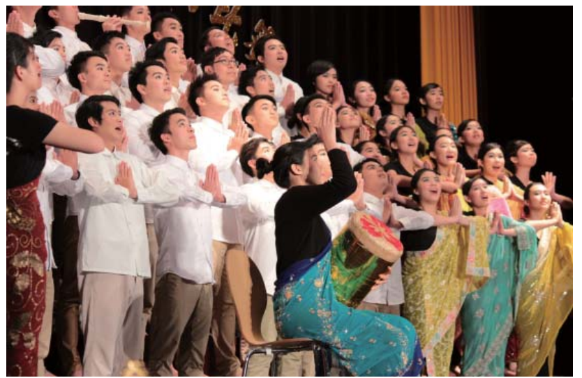
The champion of the Culture Cup last year Department of Public Finance goes to the second prize this year.

"I was the conductor of Chien Kuo High School's Marching Band, through which I built up many experiences of conducting. I consider that the conductor is not just a person who beats time but someone who can inspire all the members to sing the song with feelings."