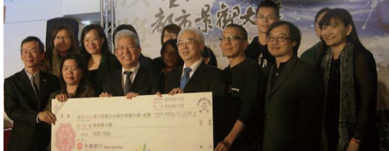
▲(上圖)水岸實驗劇場 (下圖)政大團隊領獎