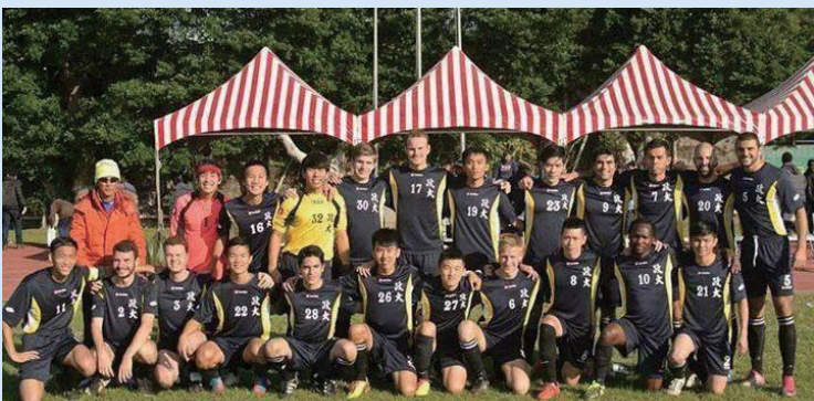
▲政大足球隊全體一心，誓言要再創UFA奇蹟。

今年公開男子組二級共有17支隊伍，預賽分四組取分組前三名晉級，複賽預計明年三月初在嘉義吳鳳科技大學舉行。