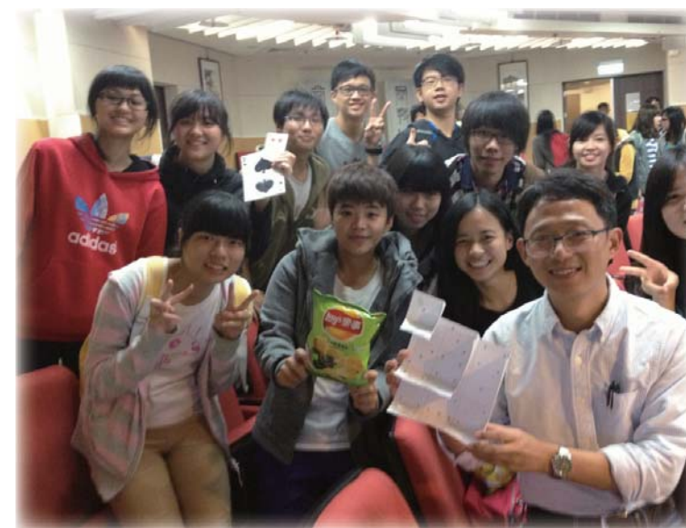
▲把握機會多向老師請益，提高學習成效。