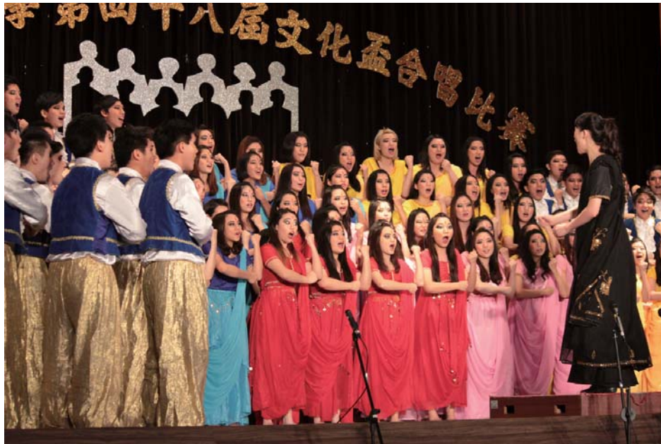
▲企管系以古老方言坦米爾語演唱自選曲，獲得48屆文化盃冠軍。