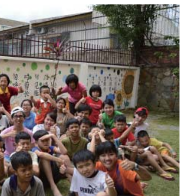
▲政馬志工隊為新山孤兒院打造美麗新牆