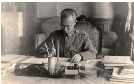
▲特展將重現陳誠書房 照片提供/社資中心

此外，社資中心也取得陳誠家屬信任與協助，提供包括陳誠曾使用的書桌、椅子、毛筆等一手文物，將還原他的生活面貌。陳誠長子、前監察院長陳履安回憶父親雖然身為職業軍人，但在家中從不大聲講話，以身作則示範禮貌待人，