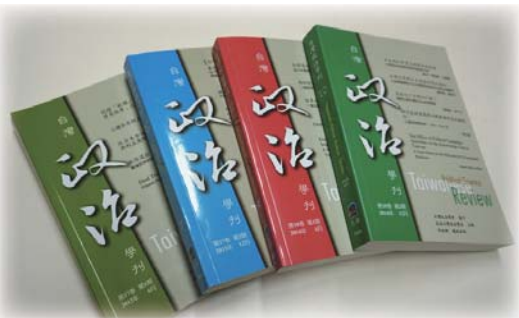
▲臺灣政治學刊受國際學界肯定

Scopus現階段收錄了121種臺灣發行期刊，但其中只有25種屬於人文社會期刊。