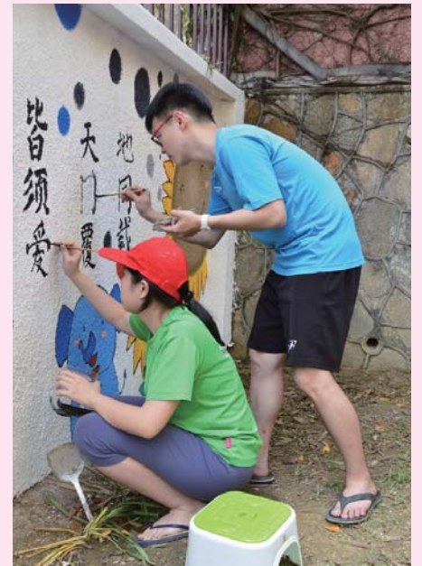
NCCU Malaysian students volunteer to paint for an orphanage in Malaysia.

"Therefore, we can finish the painting earlier and have time to play with children," she said.