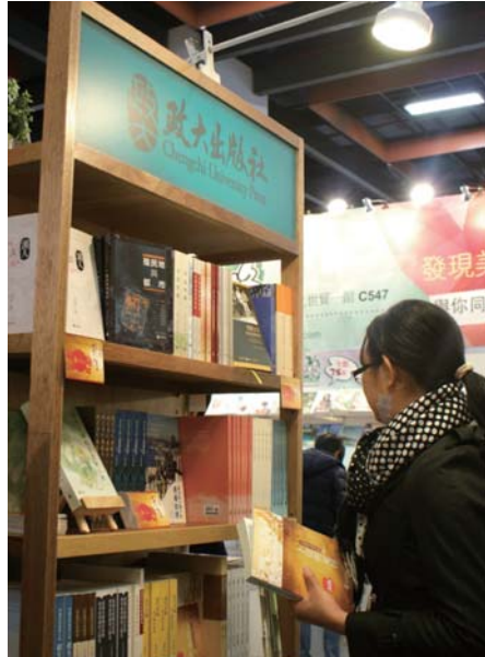
▲政大出版社參與臺北國際書展，與讀者近距離接觸。 攝影/羅皓恩

「團結力量大」，政大出版社肯定眾志成城的力量龐大，除了擴大讀者群，也有更多人力和經費可以參與香港書展、美國亞洲研究學會書展等國際展覽，進而增加國際能見度，在教育部支持下，未來各校還會持續深化合作，促進大學學術向世界開放。