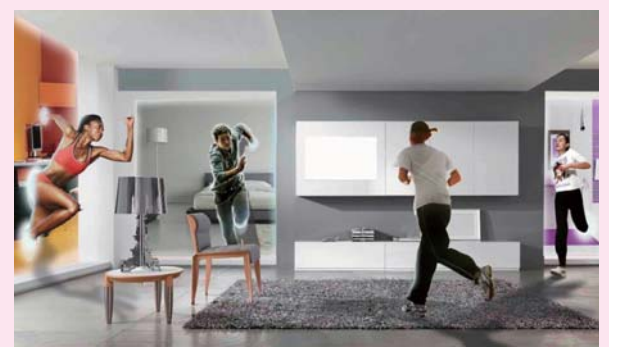
▲《出夢入夢》作品示意

陶亞倫比較，目前市面上成品會受到使用者的真實空間限制，穿戴設備後能移動的範圍很小，但在這項展覽中，團隊將突破感測真實空間中的定位困境，並規劃系統擴大為一次