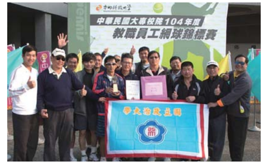
▲政大教職員網球好手勇奪佳績

教職員網球社表示，為校爭光之外，選手們享受揮拍過程，從比賽激烈競爭中強化身心，都是正向幫助。