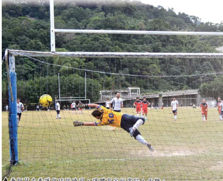
▲兼顧草皮養護與球隊練習，讓體育室經常陷入兩難。