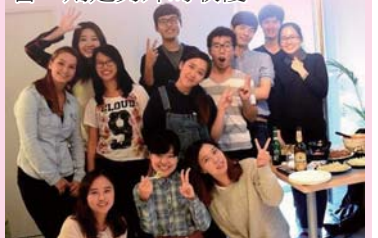
▲作者為身著「9」圖樣衣服者

除了會自動上鎖的教室外，在科隆商學院，因為每個班級規模都算小，所以很多課程都會安排田野考察(field trip)。像博物館管理課程的老師就直接帶著大家去博物館，旅館管理課也會到科隆最有名的一間旅館參觀，踏出教室也有很多學習，則是另外的收穫。