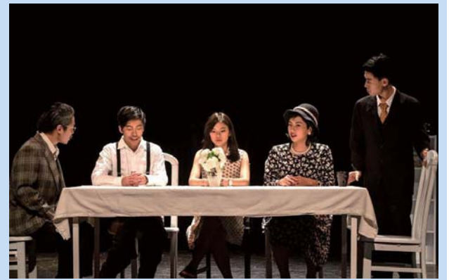
▲《革命路115號》思考生命困境

「真正要去做什麼事還是一個人比較好。」觀眾、新聞三簡紹琪對劇末這句話觸動良多，認為能確實反應到生活中真實面貌。看完戲，她對整齣劇的風格意外，「原本以為是皆大歡喜的結局」，但仍肯定呼應誠實的定調。