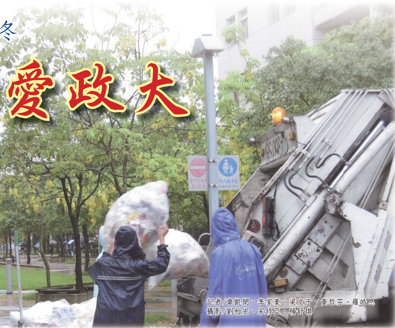
記者/章凱閔、李家豪、梁文子、黃哲芬、羅皓恩