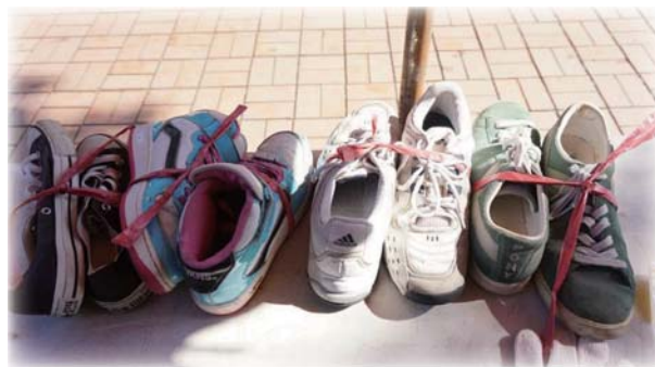
▲政大同學踴躍捐助二手鞋

《更正啟事》 本版上期報導48屆文化盃得獎名單，第六名漏列中文系，謹向中文系致歉並致賀喜。