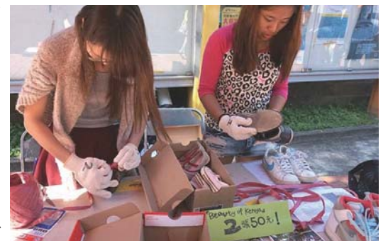
The team collect shoes from NCCU students on campus.

Before reaching out to Storeasy, Cheng has tried to apply for a storage space and funding from NCCU, but her application was denied because the university can only accept the application on the condition that the project is organized by a student club instead of an individual. Cheng suggested NCCU amend the regulations and speed up the process of verification to allow more students to utilize the resources of NCCU.