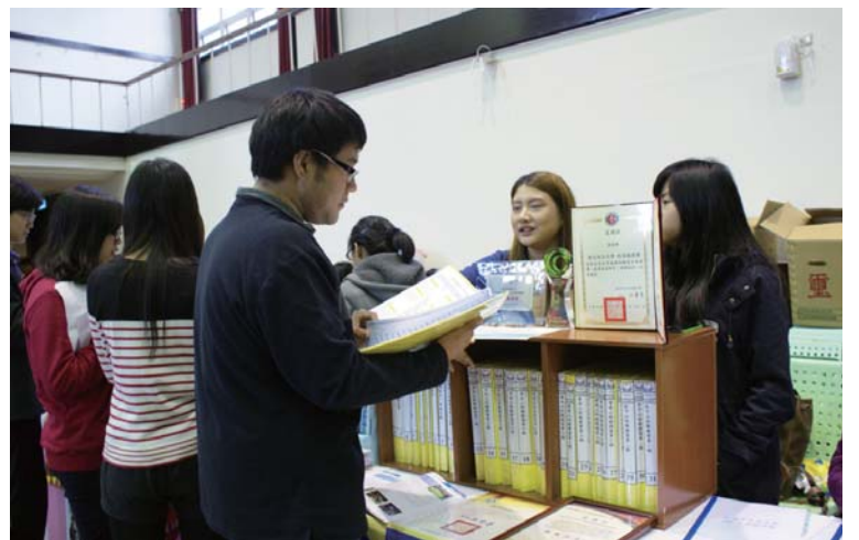
▲指南服務團長期深耕特定區域，社團傳承完整，連續獲得社團評鑑特優肯定，摘下角色。

課外組表示，依照「學生社團評鑑暨觀摩實施要點」，今年度共有135個學生社團必須參與評鑑。評審結果除了特優社團外，還有如來實證社等38個社團獲得「優等」，國際經濟商管學生會等59個社團獲「甲等」，都獲頒獎狀和獎金。