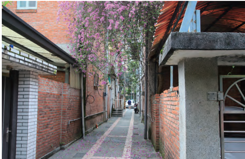
▲化南新村的兩層紅磚屋牆景觀，近年經常吸引許多劇組取景。

綜觀這些作品，其中兩組以河堤作為設計場域，希望讓更多政大人認識河堤的美，體驗河堤帶來的休閒、舒適感；也有同學想像搭建「透明橋」，配合水岸電梯，設計「上山的三種設計」，或者打造多條四