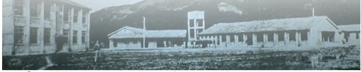
▲透過「政大與中華民國發展」特展，可重溫政大在臺復校初期校區情景。