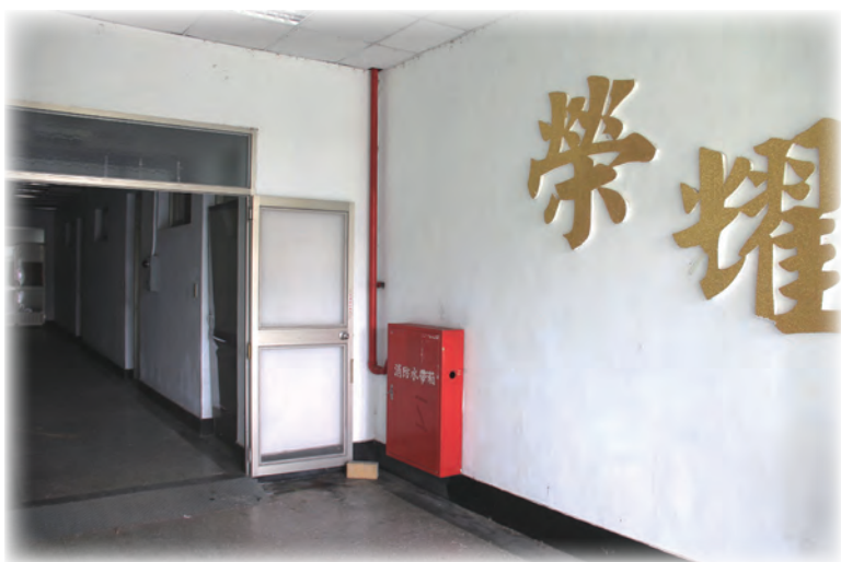
▲指南山莊營區辦公空間