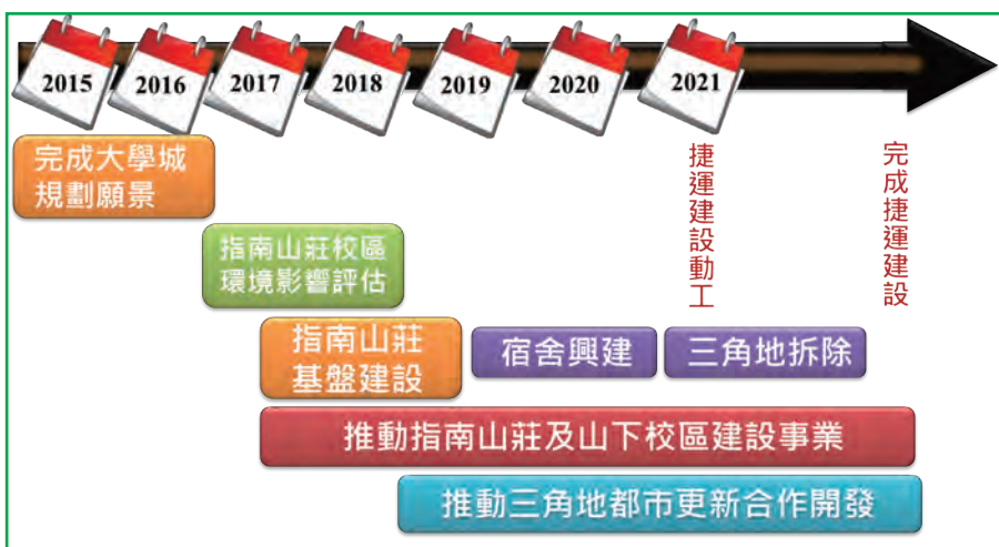
推動大學城計畫預定時程圖