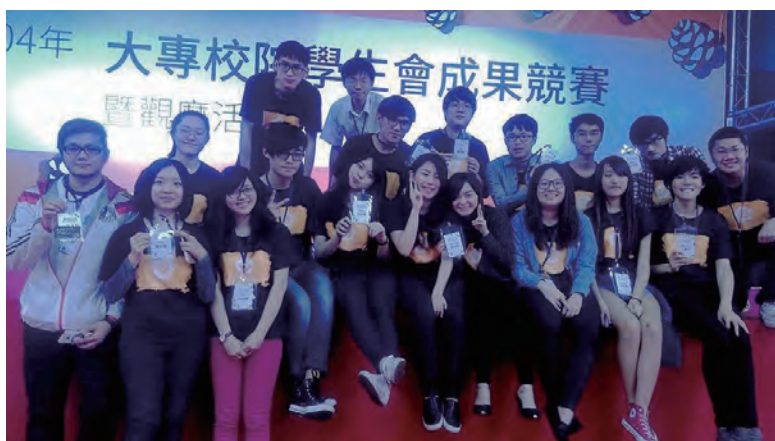
▲學生會獲得全國學生自治組織競賽一般大學組特優

【學務處課外組訊】教育部青年發展署3月28-29日在中央大學舉辦「全校性學生自治組織成果競賽暨觀摩活動」，學生會在百餘所大專院校中脫穎而出，榮獲一般大學組「特優」，較去年優等成績更上一層樓。