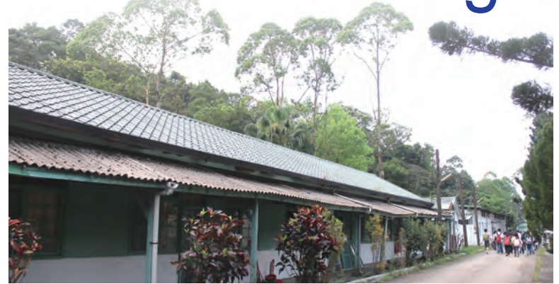
Zhinan Village (指南山莊) becomes a new campus of NCCU from this year.