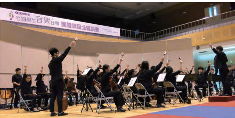
▲華夏國樂社員手搖波浪鼓演出自選曲《黃河暢想》

【記者李家豪報導】華夏國樂社參加103學年度全國學生音樂比賽，榮獲大專國樂合奏B組特優第一名，創下近年來最好成績；絲竹室內樂項目中，也拿到特優第四名。