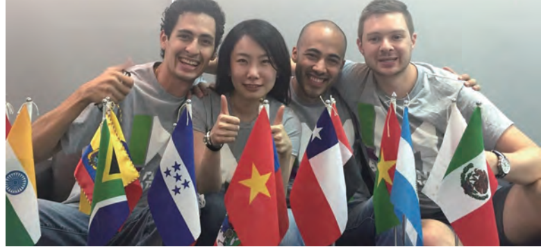
▲從霍特獎出發，IMBA學生團隊預備實際出國興學

這支團隊今年三月中在杜拜區域賽中一舉贏得第二名，創下臺灣學校參與霍特獎的最佳紀錄。為了持續爭取到紐約最終決賽百萬美金獎金，決定再參與網路競賽，霍特獎主辦單位預定臺灣時間5月16日清晨公布進入決賽名單。