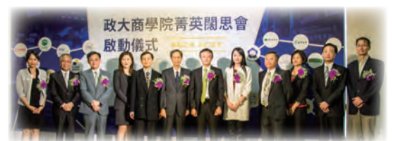
▲各產業加入菁英閣思會平台交流

而企業也將提供「閣思獎學金資源」，鼓勵學生接觸更多元的學習管道，提升國際移動力與適應力，現階段已經確認將獲得兩年140萬獎學金，期待能協助MBA學生將國際文化和思維帶入臺灣，縮短理論與實務的差距。至於促進企業間交流互動目標，則將透過每季辦理的「閣思論壇」達成，鼓勵各產業標竿企業經驗分享，提升高階主管的專業能力與素質，並建立跨產業人脈。