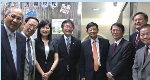
▲韓國文化教育中心揭牌，多方推動韓國學研究。

郭秋雯表示，在這項計畫下，成立「韓國文化教育中心」屬第一步，接下來還將新聘講師並在五年內開設三門選