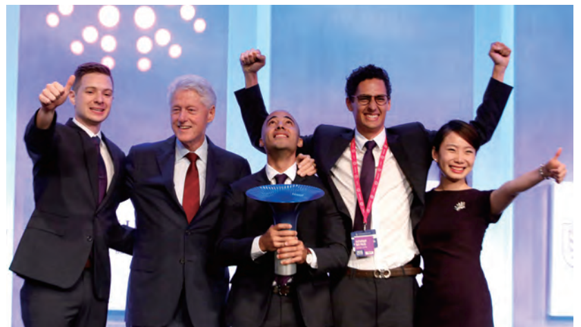
IMPCT team of IMBA wins the 2015 Hult Prize from the former US President Bill Clinton.