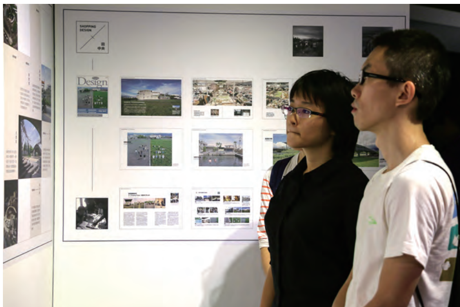
▲政大同學把握機會參觀展覽，了解建築設計藝術背後的思維。

「聽·說 田中央」特展即日起到12月31日，每星期一到五上午11時到下午五時在藝文空間展出，配合展覽，藝文中心還將推出編輯人與建築師跨界對談講座。