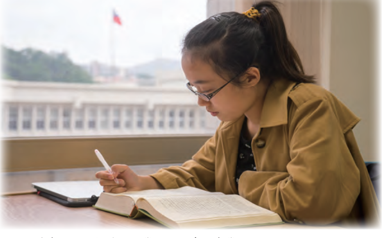
▲課程精實工程目標鼓勵同學們更認真扎實學習

面對學生的質疑，周玲臺認為，改革初期難免出現混亂，但鼓勵學生勇於嘗試了解課程精實，不要一味反對，個人好好重新審視學習初衷和學習情形，真正落實扎實學習，才能真正達成接受教育的目標。