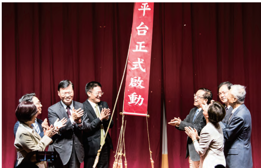
▲政大宣布成立創新創業平台，支持同學們勇於實踐夢想。

慧之外，創新創業平台計畫也獲得10位捐助者贊助創業實踐助學金。遠見·天下文化事業群發行人暨CEO王力行希望同學們能夠發揮熱情，掌握科技時代帶來的各種機會。