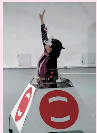
▲數位內容學程師生首度在校外舉辦成果展，獲得好評。

傳播學院表示，當今世界各行動裝置大廠已經紛紛投入鉅資發展VR虛擬平台與內容，團隊在極少研發經費下，率先完成殺手級的VR平台，以無線體感裝置與移動偵測技術勝出，使用者身體得以最自然的方式行動於虛擬空間中，正展現政大研發團隊小而精的影響力，也