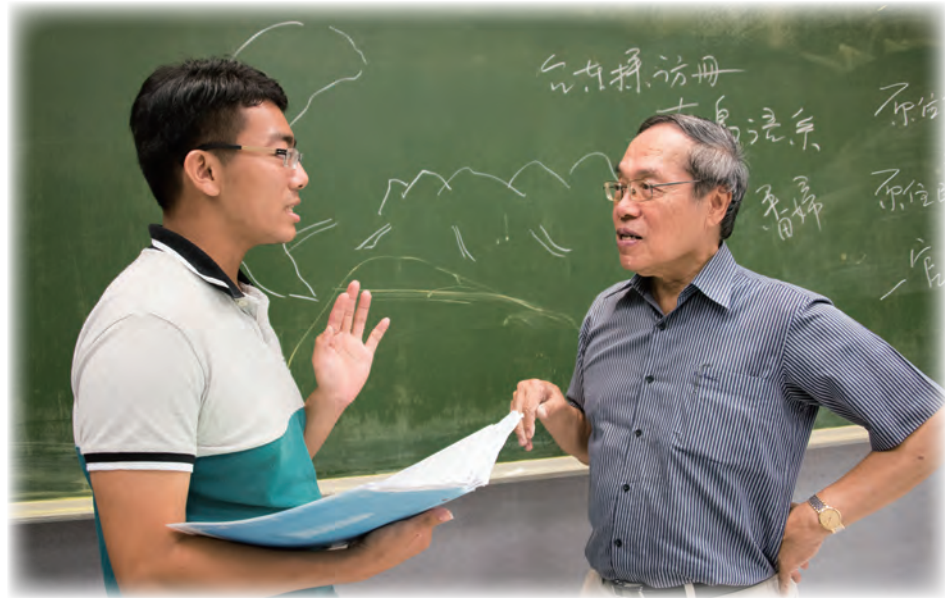
▲課程精實下，每一堂課的課程強度將更扎實。

針對教研分流下的多元評量機制，教育系教授周祝瑛肯定整體方案立意良善，但目前方案恐怕欠缺更深刻的風險評估，降低教學負擔是否真能提高研究質量？在降低授課學分數的前提下，如何不致因此都走向研究取向道路，建議應有更多實證研究支持，避免造成其他問題。