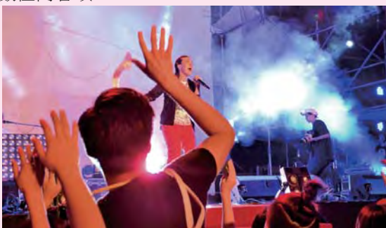
▲「娛樂產業與新媒體創意」修課學生舉辦音樂節，實際練習策劃與執行活動能力。