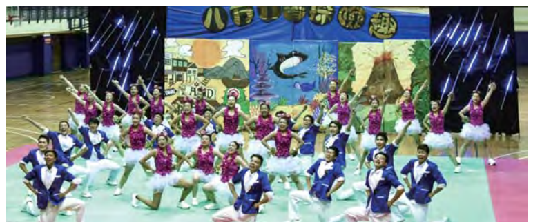
▲地政系成功達成啦啦隊三連霸目標