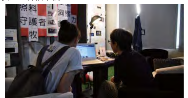
▲(左)數位內容學士學位學程學生比比觀摩作品；(右)廣電系學生展現策展能力。