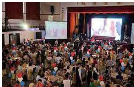
▲校友齊聚四維堂

【綜合報導】超過400位第46屆、畢業三十年校友5月14日共同返校，提前祝福政大89週年校慶生日快樂。校友們也聯合捐贈360萬元作為「薪傳學生助學金」，幫助經濟弱勢同學能夠順利完成學業。相隔三十年再回到校園，許多校友都訝異學校變化很大，羨慕學弟妹有好的學習環境。