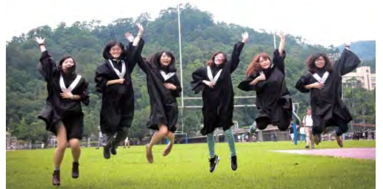
Graduates celebrate their finishing school on campus.