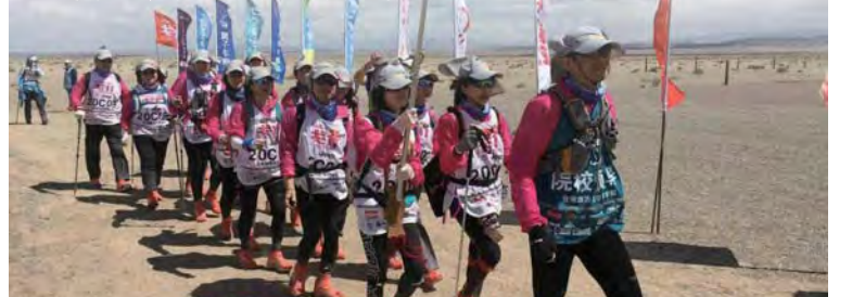
▲EMBA學生挑戰戈壁

四項大獎。EMBA由校長周行一領軍，肯定團員歷經近一年訓練到踏上戈壁，讓他見識到團隊的偉大力量，也充分發揮政大校訓「親愛精誠」的精神。