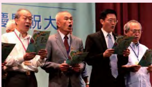
The Class 1966 come back and sing school songs after 50 years.

"I named it by its function," Lu said. "The year book will help NCCU students to look back and see what we have done."