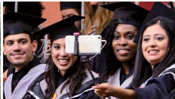
▲(左圖)EMBA學生開心拍攝紀念照片；(右圖)IMBA學生把握機會自拍留念。