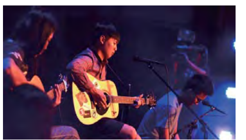
▲老王樂團

老王樂團以〈穩定生活多美好 三年五年高普考〉寫出生活中的迷惘，嘲諷社會體制的僵固，表達厭世的心情。評審Doris讚賞，「整體表現穩定，不只是主唱投入其中，所有樂