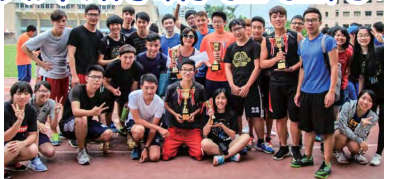
▲應數系再度連霸校慶運動會總錦標與精神總錦標

體育室主任王清欉表示，預計今年七月起，體育館就要展開為期一年整修工程，無法避免可能影響明年五月校慶運動會，研議可能配合新體育館完工延期舉行；鼓勵更多隊伍參與創意啦啦隊競賽，醞釀能單獨另外舉辦。