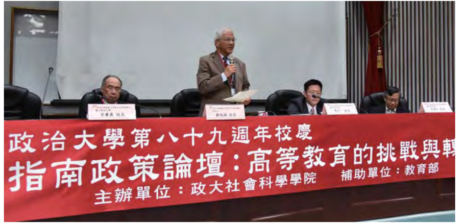
▲社會科學學院主辦指南論壇，探討高等教育轉型與挑戰。