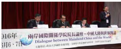
▲兩岸國際關係研究學者齊聚

【記者陳怡菁報導】國際事務學院6月6-7日再度舉辦「兩岸國際關係學院院長論壇」，順應臺灣政權輪替、研商兩岸情勢與國際關係，今年主題聚焦「中國大陸與世界對話」，除了兩岸三地國際事務相關學院院長，也邀請美、日學者共商中國與美國的關係、與周邊國家的外交發展，並觸及中國