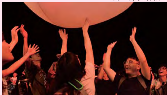
▲「娛樂產業與新媒體創意」修課學生舉辦音樂節，實際練習策劃與執行活動能力。

陳儒修提到，這次音樂節由課程延伸，期待學生在策展過程中學習到執行、策劃的能力，「遠比舉辦一個厲害的活動來得重要。」