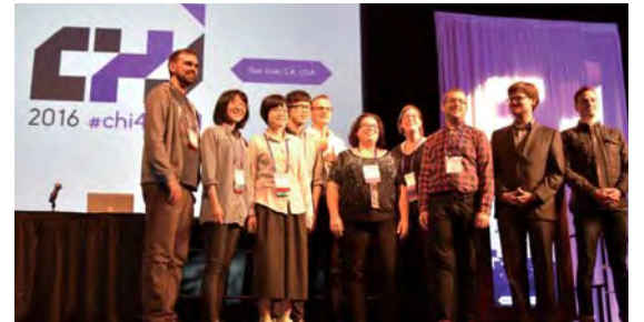
▲政大團隊(左2至4)獲得CHI大獎

得到國際肯定後，PinchFun團隊成員期待後續能在國內持續曝光，進而更完整測試，同時改善操作裝置，內容上則希望依據真實情境，不斷修正遊戲機制，以輔助遲緩兒童訓練。王奕方歡迎有興趣的治療師、機構共同參與。