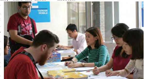
International students finish check-in process.

According to OIC, there are 170 degree students from 48 countries and 189 exchange students from 28 countries this semester.