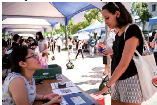
Student is interested in student clubs.

According to the Student Association, booths of the clubs from the same category were set up in the same area this time, having students to find their favorite clubs more easily.