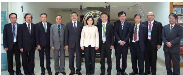
▲總統蔡英文出席東南亞年會

鼓勵年輕世代投入東南亞研究，今年年會特別成立「新生代論文獎」，楊昊表示，東南亞中心成立以來，積極開設東南亞研究推廣課程，再加上新生代論文獎鼓勵，希望能培養更多東南亞研究的新一代種子。