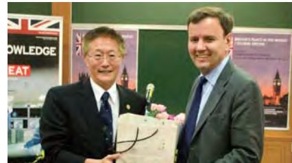
▲校長周行一（左）歡迎英國國貿部長韓斯來訪

這次來到臺灣，韓斯希望促進維持及深化英國與臺灣的貿易連結。他分析，臺灣是英國在亞洲的第六大貿易夥伴，英國則是臺灣在歐洲的第三大貿易夥伴，彼此貿易投資關係近幾年持續成長，未來還有很多發展空間。