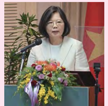
President Tsai Ing-wen (蔡英文)