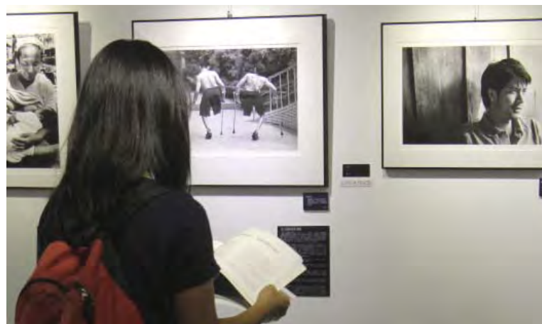
▲資深攝影記者楊永智攝影展即日起展出