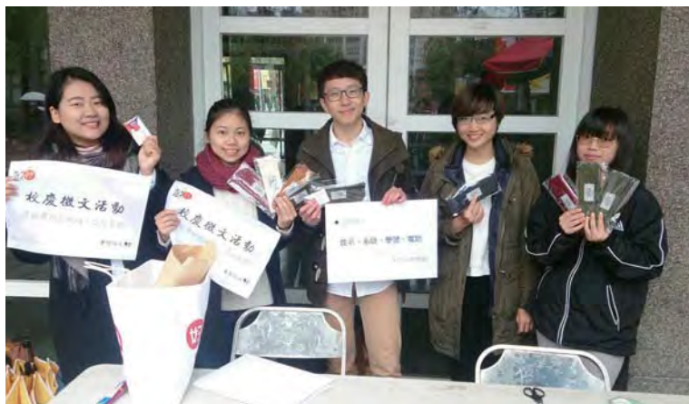
▲夢想政大活動吸引許多同學參與。