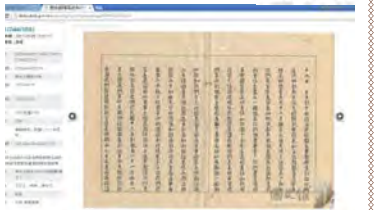
▲國史館珍藏政大史料

國史館所藏本校大陸時期檔案雖然零散，但透過數位化檢索系統，將政大校史呈現在讀者眼前，期盼有興趣的朋友來館閱覽，一同追尋先行者的足跡、回味本校早期的歷史風華。