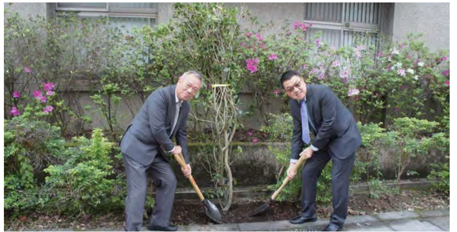
There are four Osmanthus trees, 17 pink trumpet trees, 100 the Taiwan Cherries, 30 peach blossoms and 30 Multiflora Roses in total planted on campus.

in total planted on campus. According to the office, the event represents the establishment of the coming up "forest university" plan and greens the campus. It also marks the beginning of celebrating events, including the School Bird vote and environmental protection activities, "which really worth looking forward to."