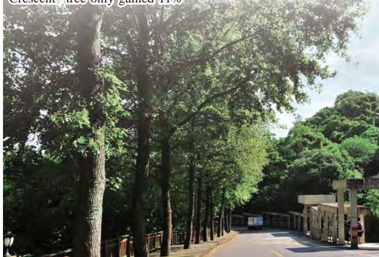
Mountain Circle 1

Ninety participants who had voted online will also be randomly picked and given exclusively souvenirs, Lien said.