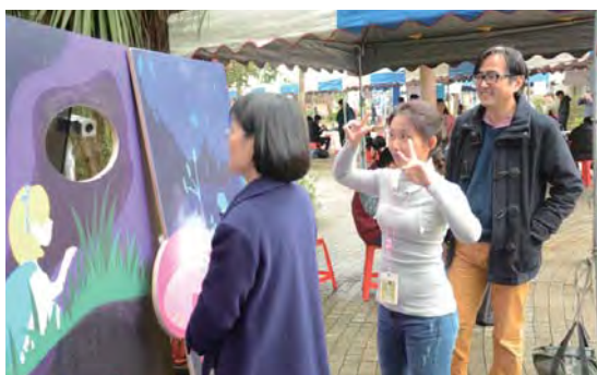
▲透過直播鏡頭和國中生互動

Soobi計畫也邀請雙溪高中、坪林國中等合作學校學生親手製作裝設QR Code的「兔子」放置政大校園，期望引起好奇掃描，進而上網認領服務需求。