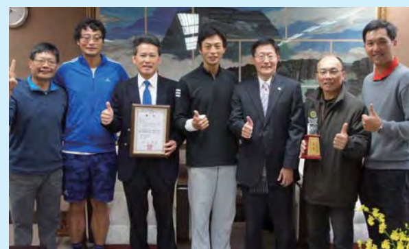
▲教職員網球隊獻獎，網球國手盧彥勳也共同祝賀。

【記者羅皓恩報導】教職員網球社 1 月中參與 106 年全國大專校院教職員工網球錦標賽，一舉抱回甲組亞軍，再創隊史最佳成績。