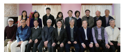
106學年度第1學期退休人員合照。

〈Prado1, 2, 3〉又名〈全景敞視、時間維度、鏡中鏡外〉，是此次特別為Medialab-Prado展場量身打造的全新虛擬實境空間，觀眾戴上VR眼鏡，站上特製台座後，沿著軌道前後移動，即能感受到空間無止盡向前延伸的虛幻感，身在展場卻也不在其中，從作品中經歷似實還虛的空間體驗。