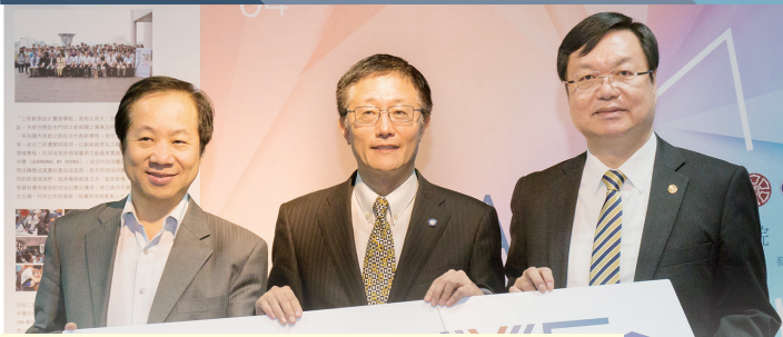
政治大學與臺灣科技大學、臺灣師範大學合作設立「創融學院」，去年底舉辦成果展，藉由專業互補，培養跨領域人才。