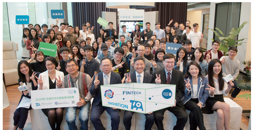
金融科技研究中心與渣打銀行合作舉辦校園創意競賽。

慧、區塊鏈、物聯網等熱門議題，透過產學聯盟，更提供學生前往香港、上海、美國矽谷等地實習機會，讓政大培養的學生，在畢業後可以立即就業，不會有學用落差。