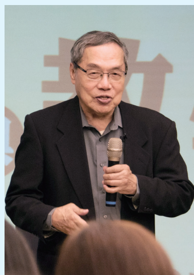
第二屆仲尼獎系列講座第一場「閱讀與教學」。

政大105年起設立仲尼獎，於全國極具標竿性與榮譽性，第三屆仲尼獎即日起至4月26日受理申請與推薦。周行一校長鼓勵政大教師踴躍提出申請，共同發揚「育人」的重要精神。歡迎政大在職且實際從事教學工作之專任教師(含專業技術人員及約聘教學人員)踴躍申請或推薦，各學院推薦一人或一人以上參加遴選，或在籍學生、畢業校友十人以上連署推薦。