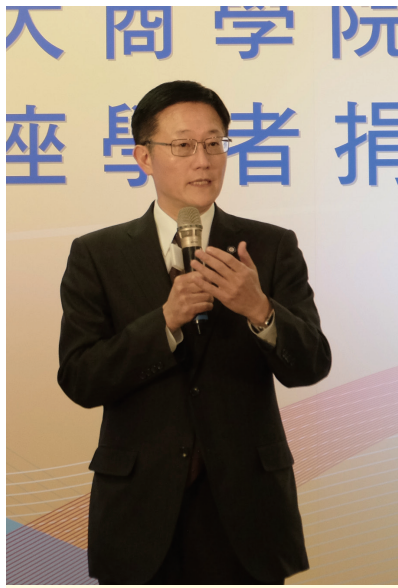
周校長鼓勵各院就員額政策積極攬才。