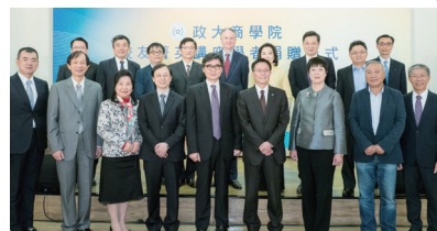
Alumni Elite Chair Scholar Program is founded in CNCCU.