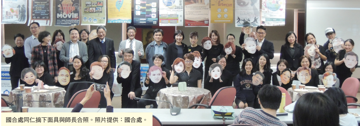
國合處同仁摘下面具與師長合照。

【記者易淳敏、柳厚勻報導】國際合作事務處1月17日舉辦「歲末感恩餐會」，感謝全校同仁不遺餘力協助推動國際化。周行一校長表示，期待在陳美芬國合處長帶領下，持續打造國際教學環境，邁向國際頂尖大學。餐會現場氣氛熱絡，國合處同仁特別戴上師長面具，周校長及與會師長更難得展現活潑一面，與國合處同仁大跳「抖肩舞」！