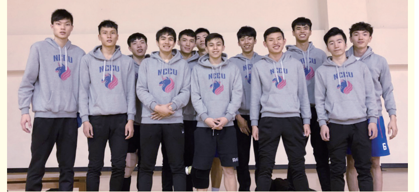
政大雄鷹挺進 UBA 男二級四強。

利奪下七連勝。 政大雄鷹每場賽事皆透過「政大雄鷹籃球隊 NCCU Griffins」臉書粉絲團直播，累積觀看次數由初期兩千多次一路攀升至五千多次，讓無法親臨現場的師生同仁與球迷，也可同步參與賽事並討論留言，成為政大雄鷹球隊最強大的後盾。