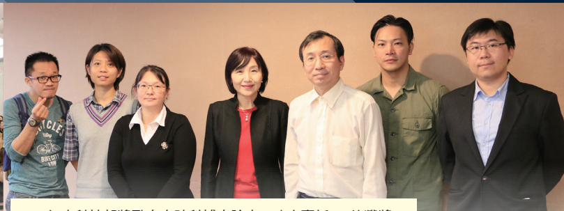
106 年度科技部獎勵人文社科博士論文，政大囊括 13 件獲獎。