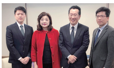
左起法學院臧正運老師、王儷玲副校長、金管會顧立雄主委、風管系彭金隆老師。

【秘書處訊】「金融監理沙盒」於今年5月開始受理申請，政大將建構「模擬監理沙盒」，透過產官學合作，降低申請成本並加速審查時間。