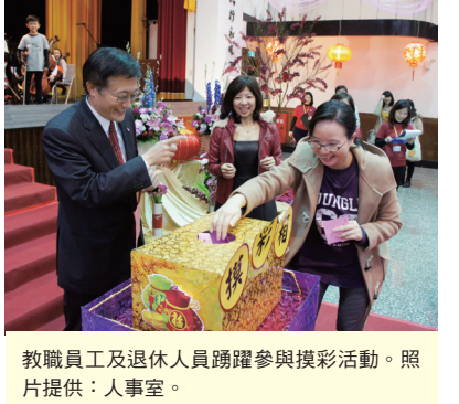
教職員工及退休人員踴躍參與摸彩活動。

伍。鄭校長勉勵政大人，在知識爆炸的時代，必須扎扎實實為專業知識打下基礎，他並引用四維堂對聯「育才閱三十餘年共勵知行永垂學統，撥亂有六千君子各憑忠愛再奠神州」，期待政大人以政大為榮，傳承「親愛精誠」的校訓精神。