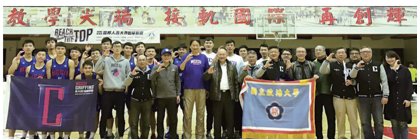
NCCU Griffins wins the entry ticket to UBA Open Men's Division I Basketball Tournament.

UBA (University Basketball Association) has organized one of the most famous sporting events in Taiwan, and the tournaments are live broadcasted to increase its popularity. Those interested in NCCU Griffins can follow them on their facebook as well as on the UBA website.