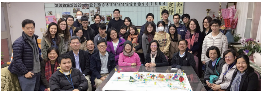
USR「興隆安康·共好文山」社區共善計畫活動。照片：社科院王信實老師。