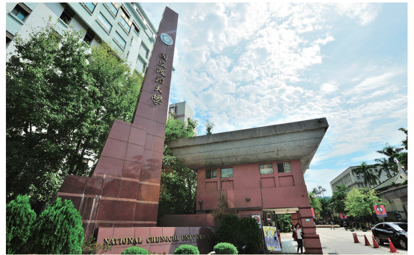
"Funding granted by MOE's Higher Education Sprout Project reflects NCCU's progress," said President Chow.

Facing strong competitors in higher education, NCCU has demonstrated what first-rate university of humanities and social science should equip with: vision, magnanimity, and the will to shoulder responsibilities.