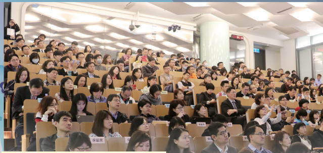
金融科技研討會，吸引眾多師生參與。