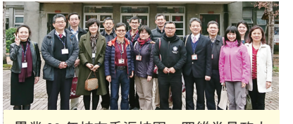
畢業 30 年校友重返校園，四維堂是政大人最熟悉的共同回憶。

身經驗，他認為擔任班級聯絡人首先要負責串聯同學，第二則是協助號召自由募捐、支持薪傳助學金。他強調，人與人之間的交流相當重要，要儘可能聯絡老同學參與活動，並多多回饋母校、造福學子。 今年為政大 91 週年校慶，將於 5 月 19 日舉辦「校友返校日」，透過各班級聯絡人號召更多校友共同出席，找回專屬政大人的光陰故事。