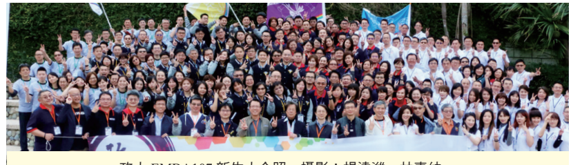
政大 EMBA107 級新生大合照。