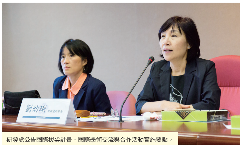
研發處公告國際拔尖計畫、國際學術交流與合作活動實施要點。

此外，為更普及與深化教研人員之國際合作，本校亦規劃以捐贈款補助教研人員赴國外至少一個月以上，與國際頂尖大學學者進行深度實質性的學術合作，以精益求精，協助本校拓展國際合作機會，深化國際網絡，特研訂「國際學術交流與合作活動實施要點(草案)」，每案補助至多30萬元，預計4月30日截止申請。