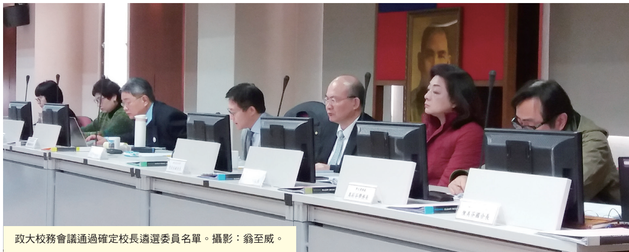
政大校務會議通過確定校長遴選委員名單。

【秘書處訊】政大1月5日第197次校務會議經無記名投票選出18位校長遴選委員會委員，含學校代表9人、校友代表及社會公正人士9人；加上教育部遴派代表3人，共21位。周行一校長將於107年11月15日第一任期屆滿後不續任。依政大校長遴選辦法第二條規定，校長任期屆