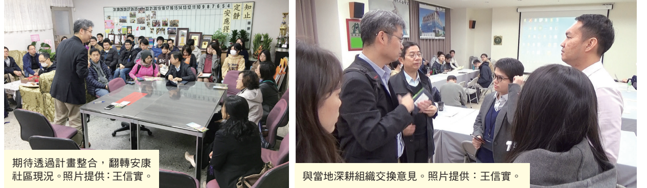
期待透過計畫整合，翻轉安康社區現況。