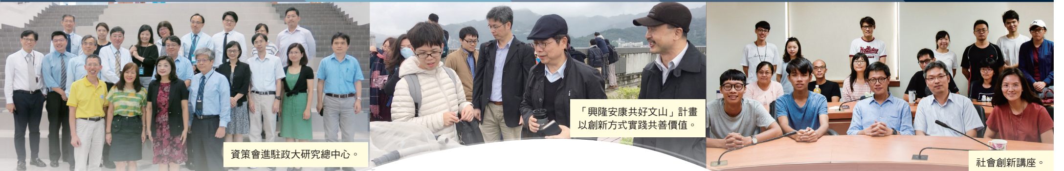
資策會進駐政大研究總中心。