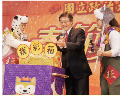
周行一校長為新春團拜抽出大獎。

高教深耕上路，周校長表示，在過去不斷累積的基礎及師生同仁努力下，政大所獲得的經費為人文社科學之冠，再次確立政大於該領域之領導地位。全校師生同仁將共同努力實踐高教深耕計畫，在教學方面，強調多元、基礎、扎實學習；在國際攬才策略上，提供各院系所最好的資源，透過即將成立的國際學院將教研環境國際化。（詳六版）