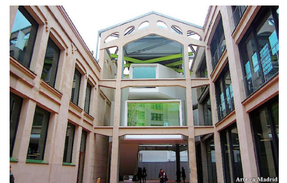
One of Professor Tao's installation exhibitions at MADATAC.

MADATAC, one of the most important new media art festivals in Europe, actively seeks for new media artists who make use of new digital technologies medium and interactive