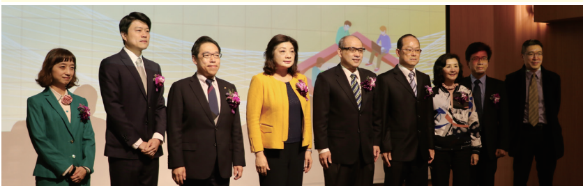
研討臺灣金融科技創新實驗機制，政大不缺席。

【秘書處訊】教育部公布「107年度高等教育深耕計畫」審查結果，校長周行一表示，政大所獲補助經費反映出學校長期整合學術研究、教育以及公共性之能量，解決社會問題、落實社會責任等成果，感謝教育部肯定政大的努力，與師生同仁們的付出與貢獻。這也顯示，政大是一所持續上升、進步的大學，居臺灣人文社科領域之領導地位。