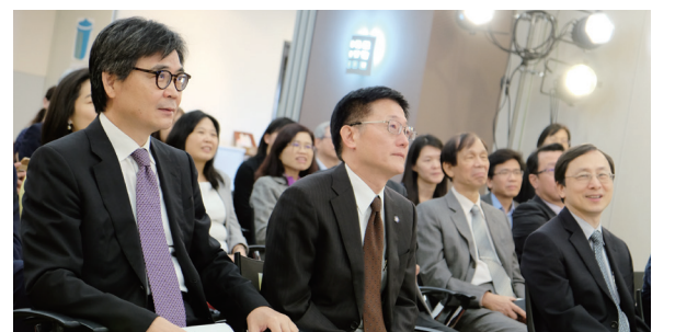
政大透過員額政策積極延攬國際人才。

【秘書處訊】為延攬全球頂尖學術人才到政大任教，周行一校長強調，將透過預核員額方式，以學院為單位進行統籌分配，簡化聘任流程，並積極爭取外部資源，協助各學院國