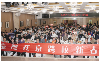
臺灣在京跨校新春團圓會大合照。

【秘書處訊】第二屆臺灣在京跨校新春團圓會1月13日於北京盛大舉行，此場盛會由政治大學北京校友會、淡江大學華北校友會、臺灣大學、輔仁大學、文化大學、成功大學、東吳大學、師範大學等23所臺灣高校校友聯合舉辦，以倍數於首屆的人