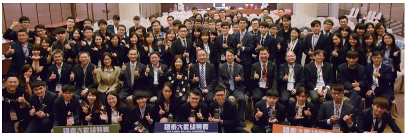
2017 國泰大數據競賽嘉賓與全體決賽參賽者合影。

【統計系訊】政大統計系與國泰人壽保險公司共同籌劃大數據創意挑戰賽，並與臺灣微軟合作，運用 Azure 雲端運算平台，讓學生實戰體驗保險業資料探勘過程。競賽內容主要以社會保險、商業保險資料為原則，挖掘保險資料潛在價值。