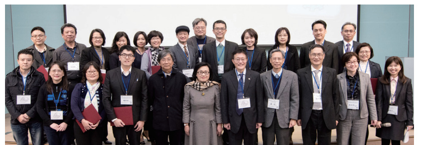
AVM 推廣有成之企業、學界代表領獎合照。

行AVM的企業分享現況，包括金融業、製造業、食品業及通路業等，透過成功案例，逐步推廣AVM。吳安