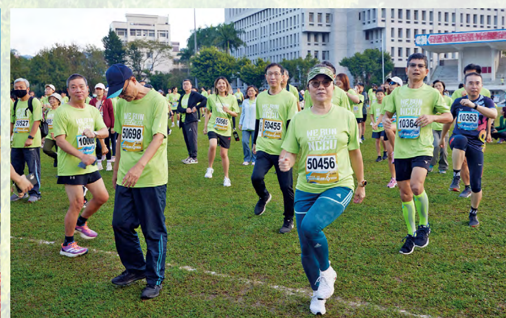
右圖：今年馬拉松報名年齡從最小3歲橫跨至最年長83歲，不少民眾全家出動，一起熱情參與活動