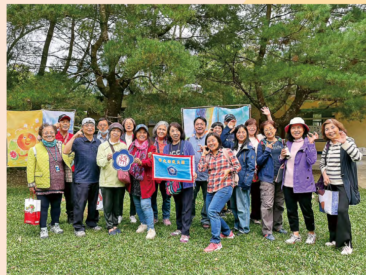
校友們在大山北月前草坪上合影