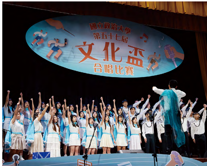
傳播學院一大二不分系演唱〈Invisible〉，服裝特別配合歌曲主題設計，傳達不受束縛、自在地飛翔的意涵（攝影：秘書處）

「自然狀態野人隊」為本屆組成最多元的隊伍，由政治系、教育系、經濟系、資管系四系同學共組，自選曲帶來充滿熱情與力量的〈Waka Waka〉。「Waka」在斯瓦西里語具有「火焰」、「閃耀」之意，他們期許政大學生在大學四年的生活中，能夠閃閃發亮、閃耀自己的青春。同學們唱著歌