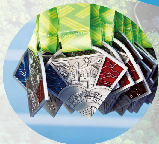
為迎接百年校慶，政大校園馬拉松推出新版獎牌