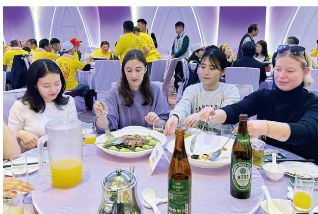
Many international students continued to participate in a banquet at night.