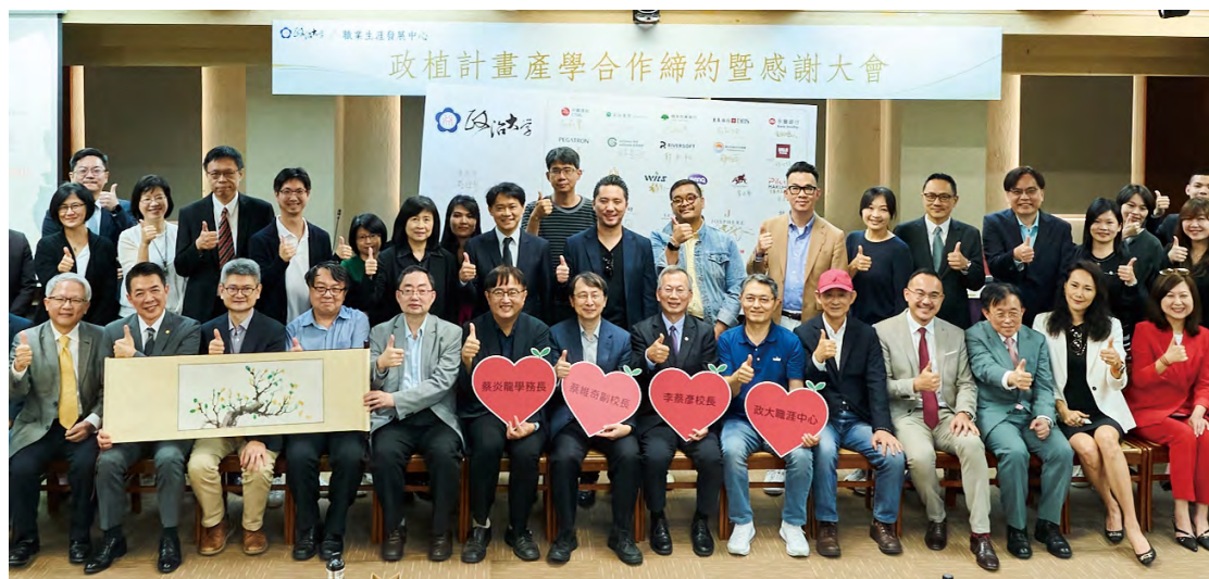
「政植計畫產學合作簽約暨感謝大會」攜手近40家知名企業，針對政大學生提供超過150個的限定實習培訓名額