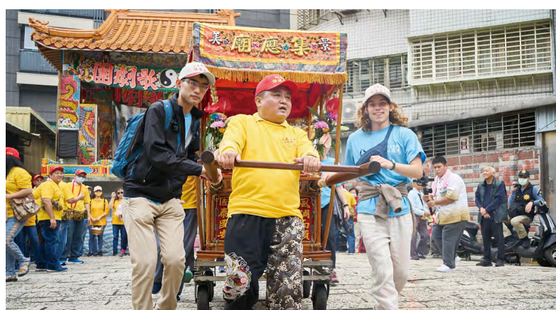
The participation in the pilgrimage has contributed to cultural understanding and engagement among the international students within the neighborhood.

Every year on the 15th day of the lunar month of October,