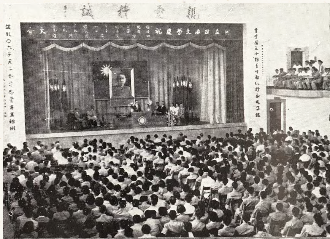
1959年5月20日，政大32週年校慶暨四維堂落成，兩旁的對聯至今仍守候在舞臺邊