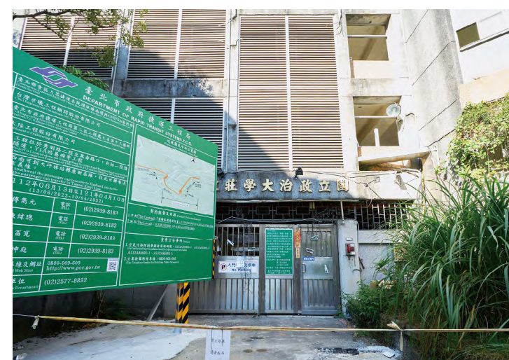
莊敬外舍拆除後，未來將變身為捷運站

未來捷運南環段全線通車後，由政大校園生活圈前往公館商圈，可從35分鐘縮短為19分鐘，從政大前往板橋站也從原先的50分鐘，縮減至30分鐘。不少學生及校友雖對宿舍的拆除