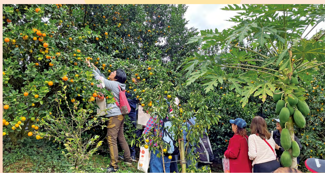
校友們穿梭林間，親手採取柑橘

清新可口的橘子香腸、多汁甜美的橘子大福，以及小農特製的醃漬蘿蔔，每一道特製橘子料理都是對味蕾的驚喜挑戰。校友們紛紛前往紀念品店，將這份美妙滋味打包回家，與家人、朋友分享。莊凱詠向校友分享一路以來創業歷程，他以一則則小故事串起大山北月與在地農家、登山客、遊客，以及自我互動，闡述自己對新竹在地文化與環境的熱愛與服務熱忱，讓全場校友以熱烈掌聲表達內心的支持與感動，見證了政大人深入地方服務，幫助在地居民共榮共好的互助精神。